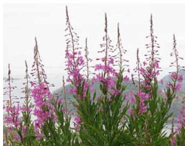
Geiterams i blomst