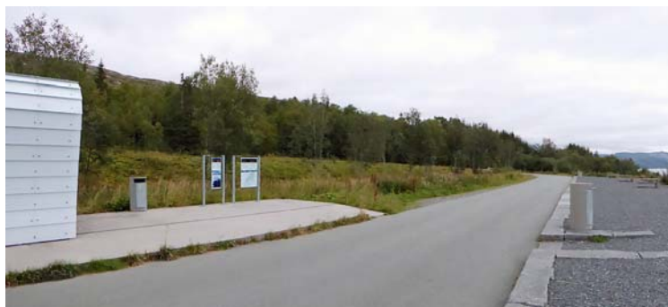
Området mellom rasteplassen og fv. 17 (midtøya) behandles som graseng. NB avklipp fjernes!

Området behandles som graseng og slås i forbindelse med kantslått, 2 ganger pr. år. Avklipp fjernes. Eksisterende løvtrær bevares i midtøya. Bartrær fjernes i midtøya.