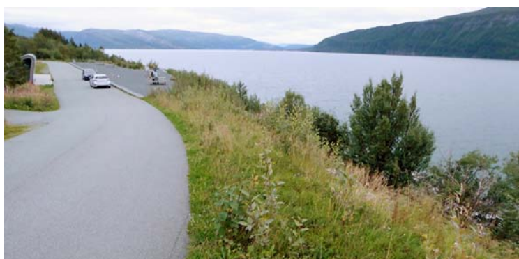
Veikant langs innkjøringene behandles som graseng og slås i forbindelse med kantslått. Det slås så langt ned i skråningene som maskinene rekker. NB avklipp fjernes!