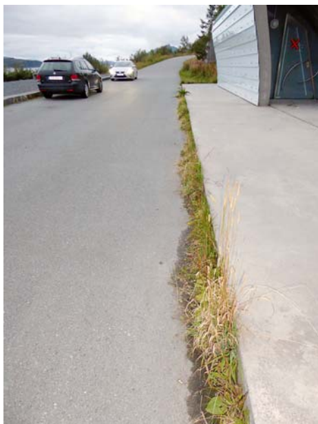
Vegetasjon mellom dekker fjernes to ganger pr år.

Vegetasjon som har vokst opp mellom ulike dekker (asfalt og betong / asfalt og steinkant) fjernes manuelt 2 ganger pr. år.