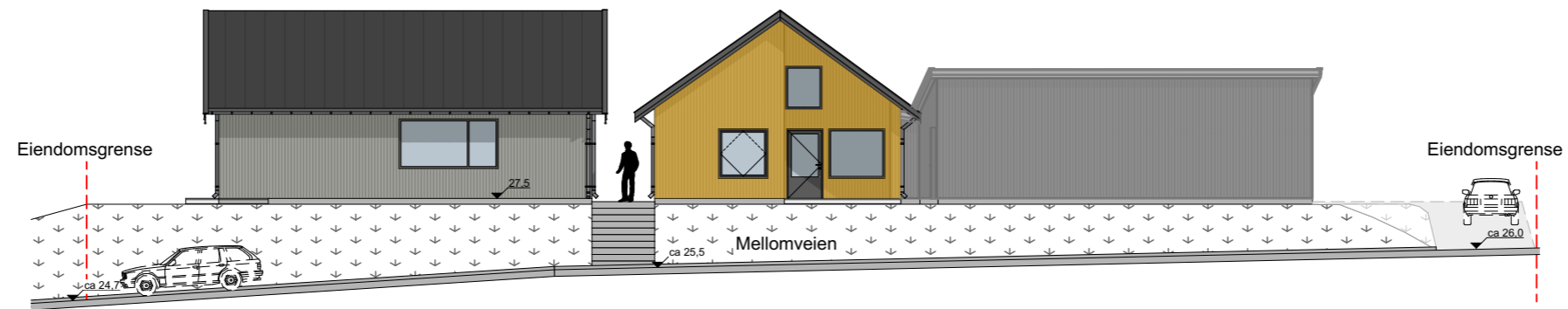
1:200 Fasade Øst