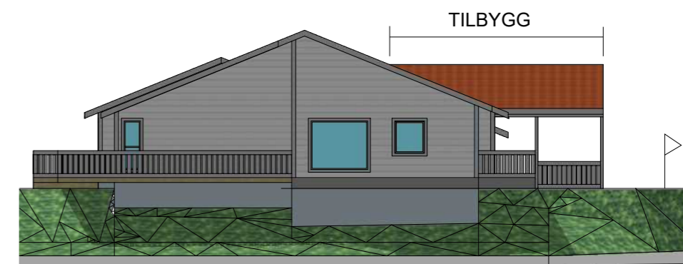
FASADE MOT SØR-ØST M=1:200

BUFELLESSKAPET, SANDEID TILBYGG OG OMBYGGING AV ØSTBØVN. 7-9 GNR 13 BNR 2, VINDAFJORD