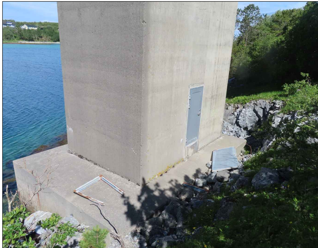
A TILKOMST 3.