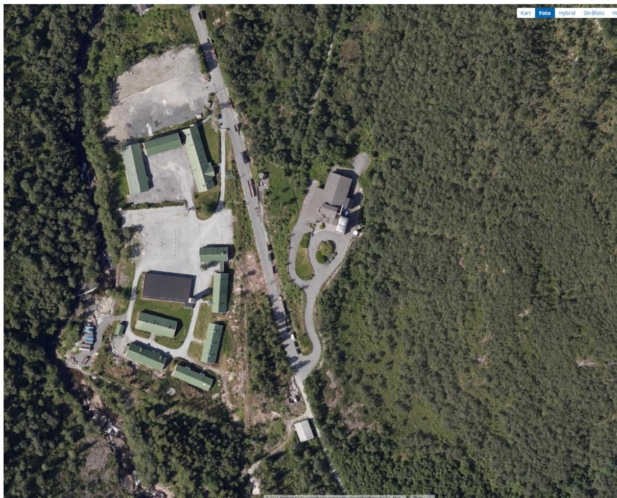
Figur 2 Luftfoto fra karttjenesten 1881 viser dagens situasjon ved vannbehandlingsanlegget

Ellers i området dukker det frem hagerømlinger og geiterams som gir et inntrykk av skrotmark og dårlig skjøtsel. Disse artene kan spre seg videre dersom de ikke holdes under kontroll.