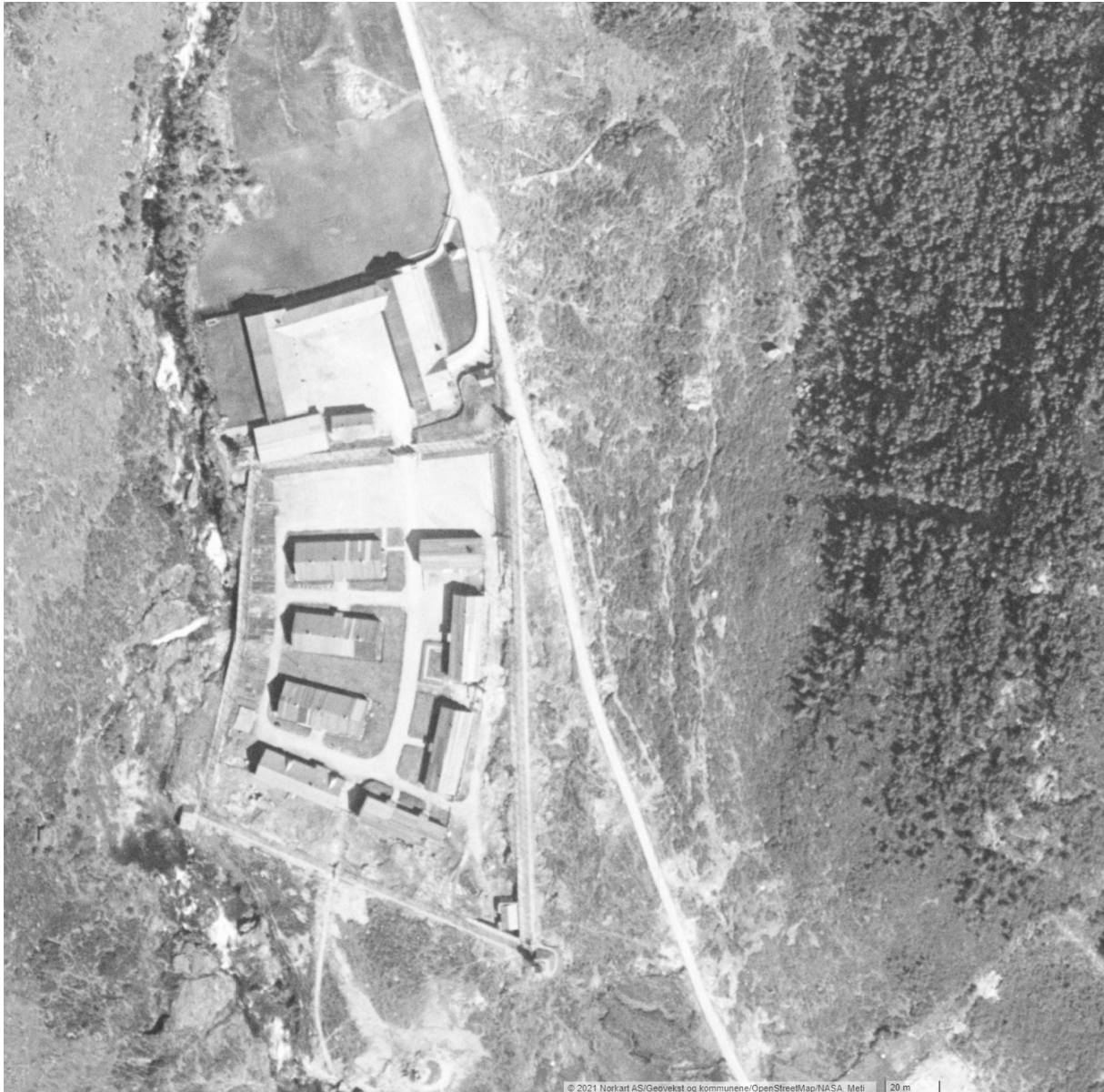
Figur 4 Viser luftfoto hentet fra karttjenesten 1881 over Espeland fangeleir i et åpent landskap tatt i 1951.

Luftfoto hentet fra karttjenesten 1881 er tatt i 1951. Trevegetasjon begrenser seg til en randzone langs bekken, og skråningen opp mot Storerinden. Mellom skogen og veien ligger et åpent beitelandskap. En etterligning av denne situasjonen skal gjenskapes i o_G01.