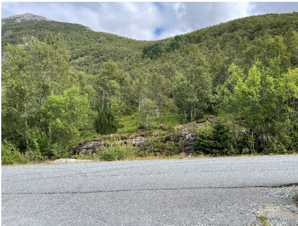
Figur 5 Bildet er tatt ved inngangen til fangeleiren med sikt opp mot Storerinden

Bildet er tatt fra inngangen til fangeleiren og sikten oppover mot Storerinden. Området for skjøtselsplanen ligger i terrenget foran i bildet. Også her er vegetasjonen typisk for området, og antagelig hvordan det har vært da fangeleiren ble anlagt. Det åpne preget kan gjenopprettes ved å felle og tynne i vegetasjonen, og skjøttes ved beiting av husdyr.