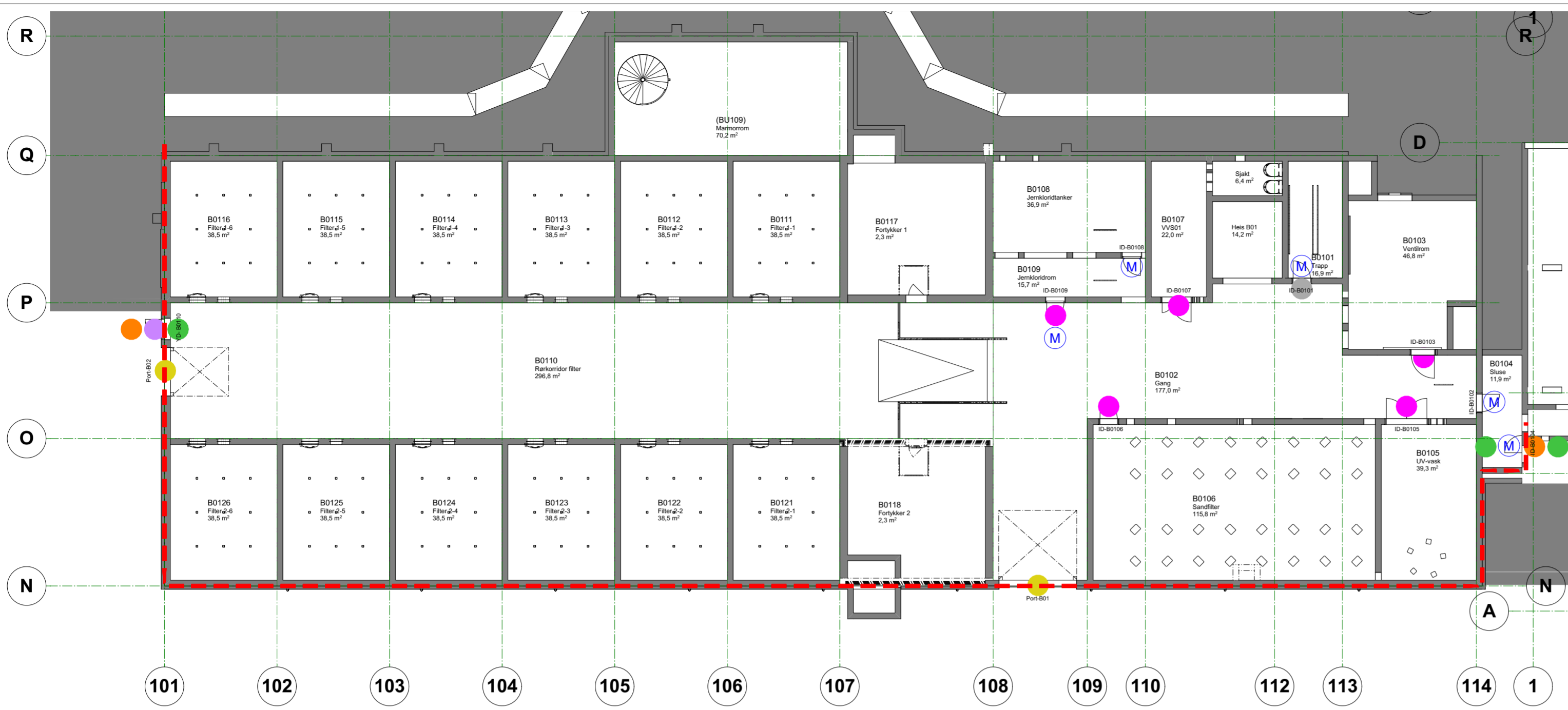
B 01 1:200