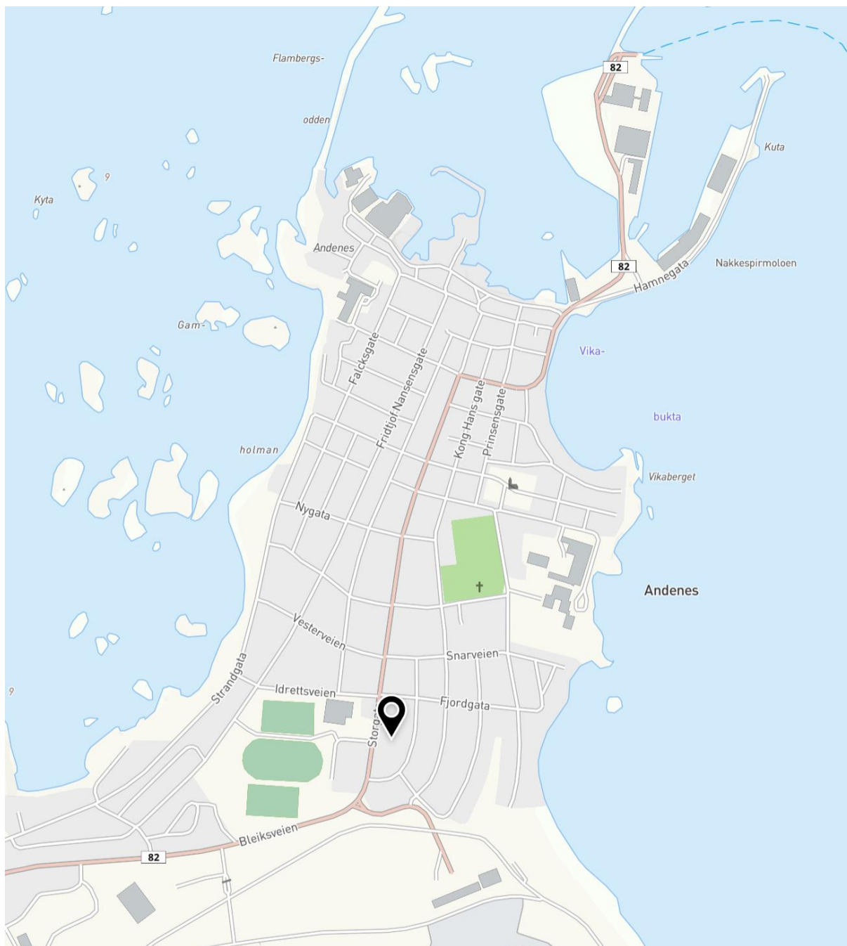
Figur 1 Oversiktskart

Kartet over viser lokalisering av planområdet (markert med markør) samt deler av Andenes. Formålet med planen er å legge til rette for etablering av omsorgsboliger på eiendommene gnr. 48 bnr. 74 (Storgata 75), bnr. 132 (Storgata 77) og bnr. 174 (Storgata 73).