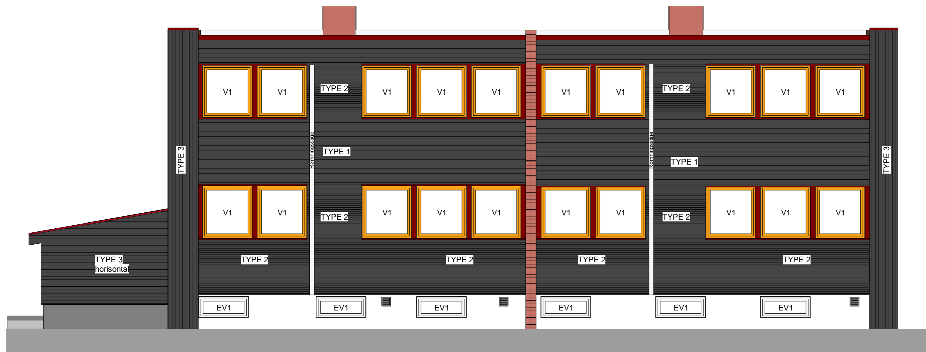
Nytt tiltak Fasade sør 1 : 50