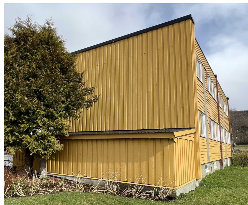
Eksisterende Fasade vest