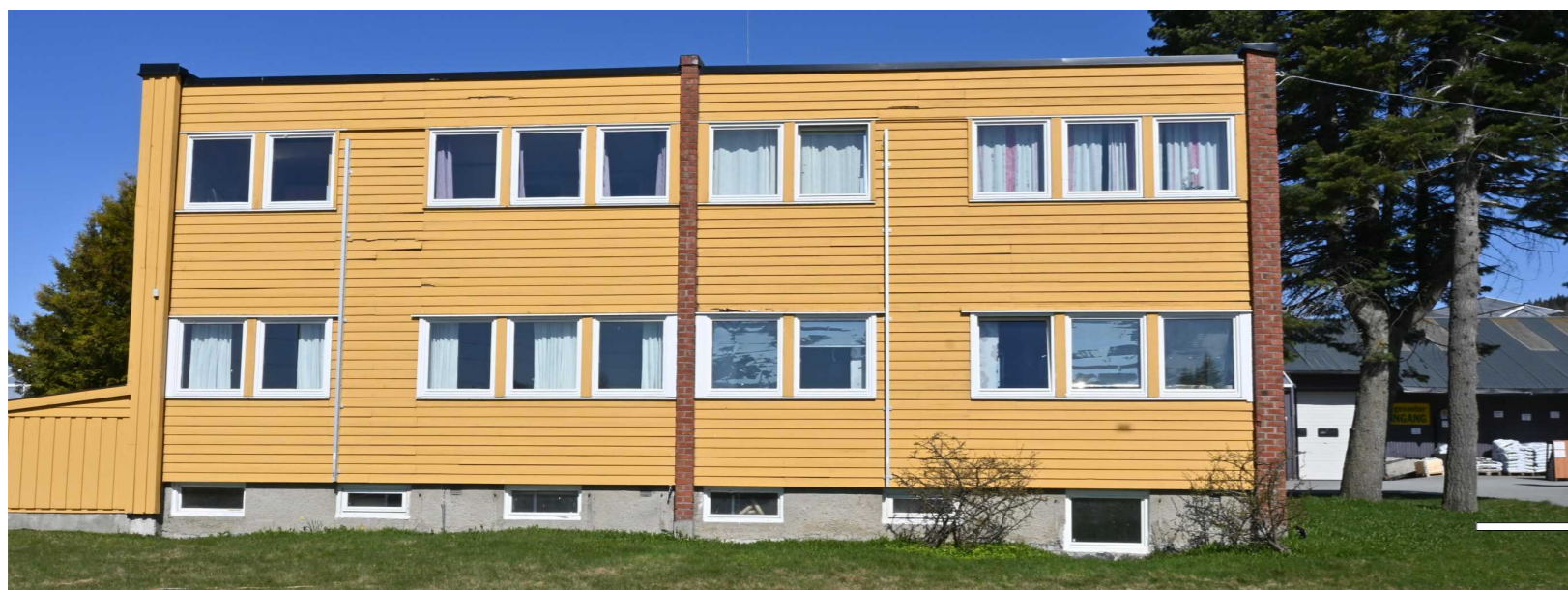
Eksisterende Fasade sør