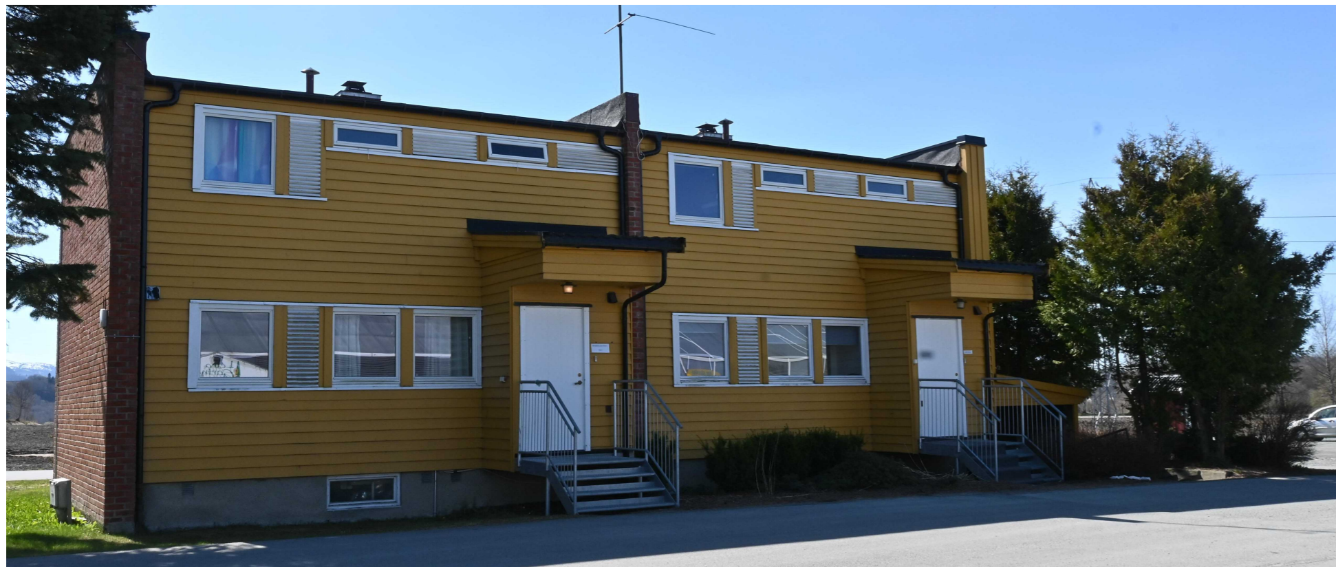
Eksisterende Fasade nord