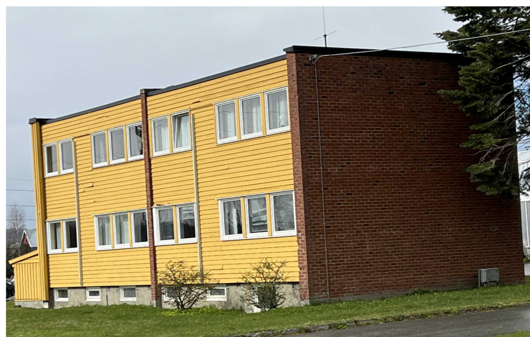
Eksisterende Fasade øst