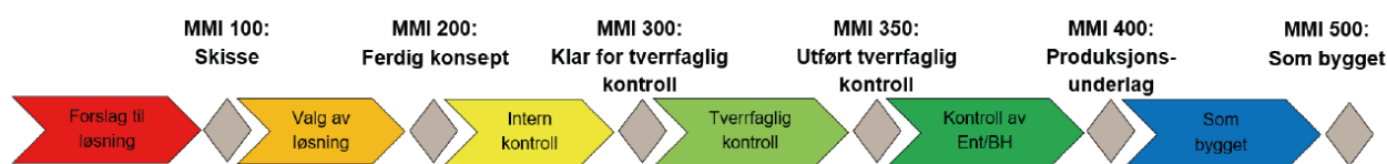
Figur 1 - Prosess MMI fra EBA

Prosjektet skal ha en omforent bruk av MMI-koder, som ved avtale kan tilpasses prosjektet utover koder angitt i veilederen. Egendefinerte MMI-koder og rutiner for bruk av disse skal omforenes i prosjektet og forankres i leverandørens BIM-gjennomføringsplan.