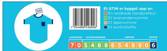
Figur 2 - Eksempel produkttypekoding, GTIN