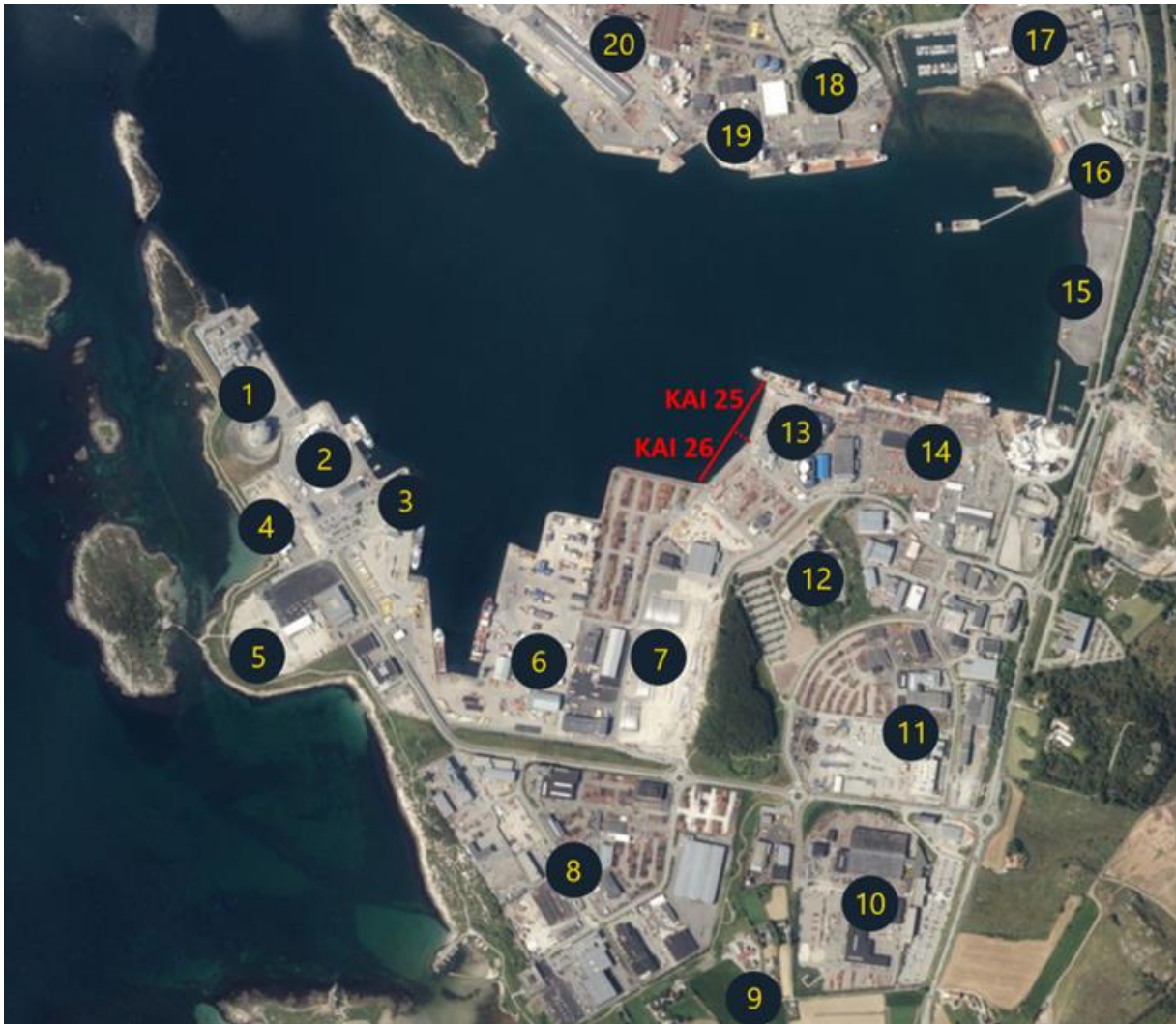
Illustrasjon 1: Virksomhetsområder i Risavika havne- og næringssområde og prosjektområde kai 25 og 26