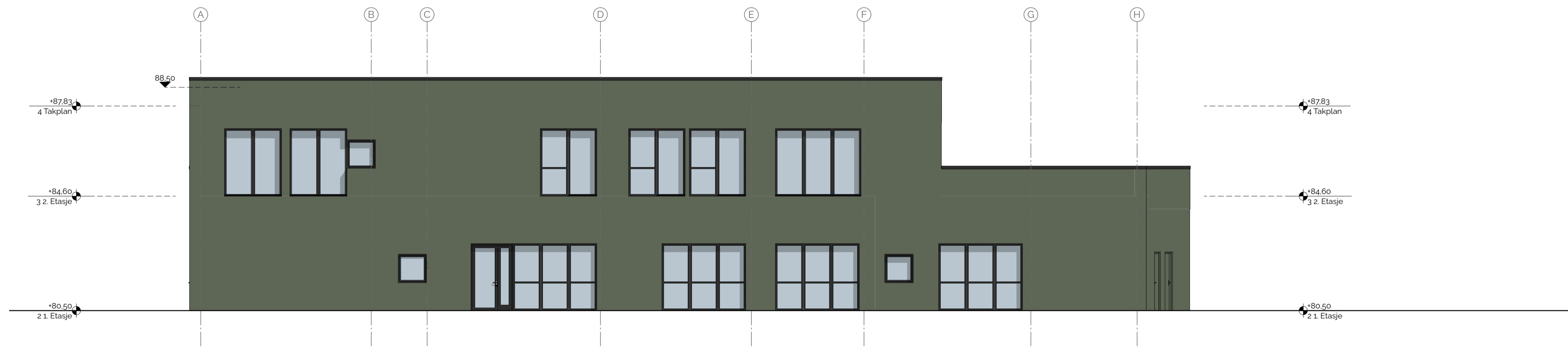
1100 Fasade Sør-vest