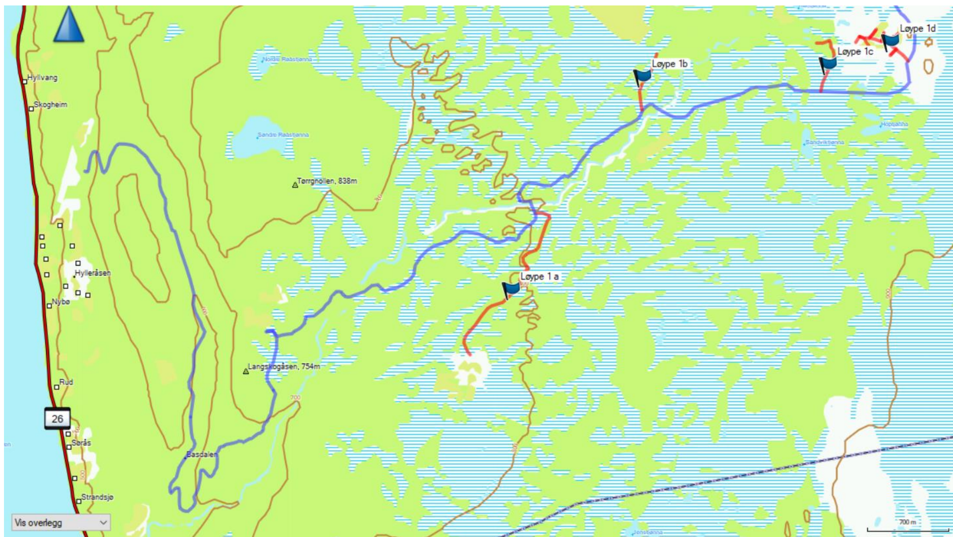
1 Løype fra eksisterende trase i Hylleråsen - Lillerøåsen