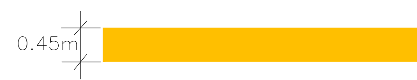
MERKING AV RULLEBANE KANTLINJE M=1:50

Merking av senterlinje skal utføres som en uavbrutt linje bestående av linjestykker og mellomrom med konstante lengder. Linjestykker og mellomrom skal tilsammen ikke være kortere enn 50m og ikke lengere enn 75m. Lengden på hver linjestykke skal minst være like lang som mellomrommet og ikke kortere enn 30m .