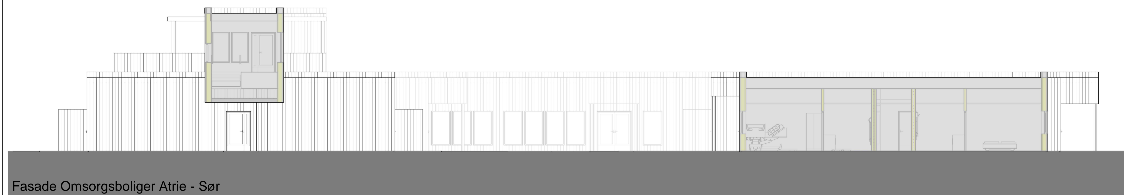
Fasade Omsorgsboliger Atrie - Sør