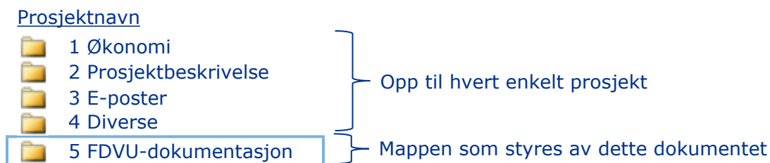
Figur 1 Eksempel på overordnet mappestruktur

Et eksempel på hvordan mappestrukturen kan se ut for et prosjekt er vist på Figur 1 .