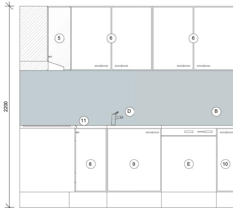
B 1 : 25