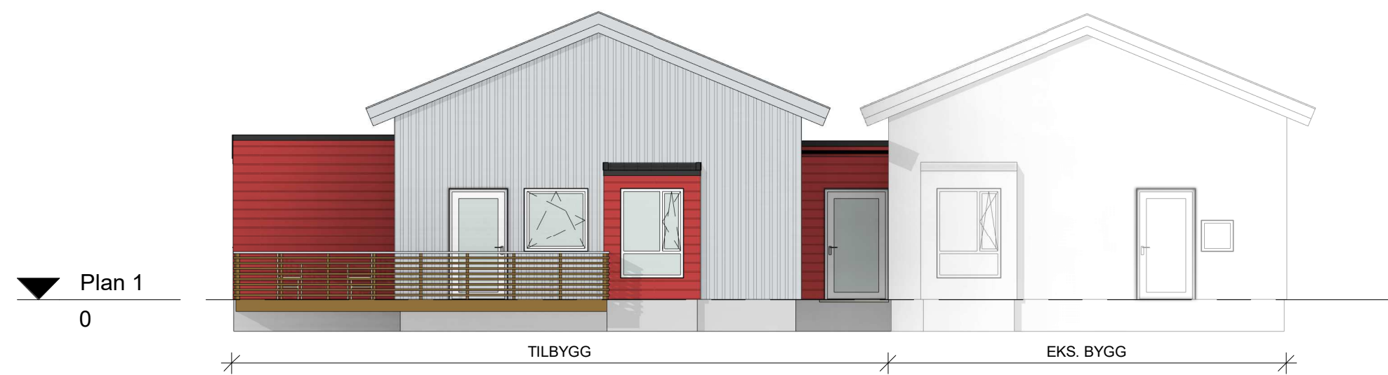
Fasade Sør 1 : 100