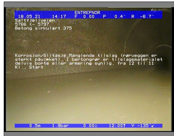
Foto: 6509_5766_5797_18052021_141753.JPG 0,5m, Korrosjon/Slitasje, Manglende tilslag (rørveggen er sterkt påvirket), I bertongrør er tilslagsmaterialet delvis borte eller armering synlig, fra 12 til 11 Kl., Start