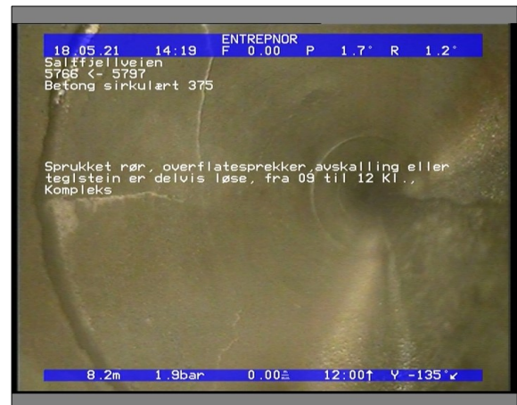
Foto: 6509_5766_5797_18052021_141909.JPG 8,21m, Sprukket rør, overflatesprekker, avskalling eller teglstein er delvis løse, fra 09 til 12 Kl., Kompleks