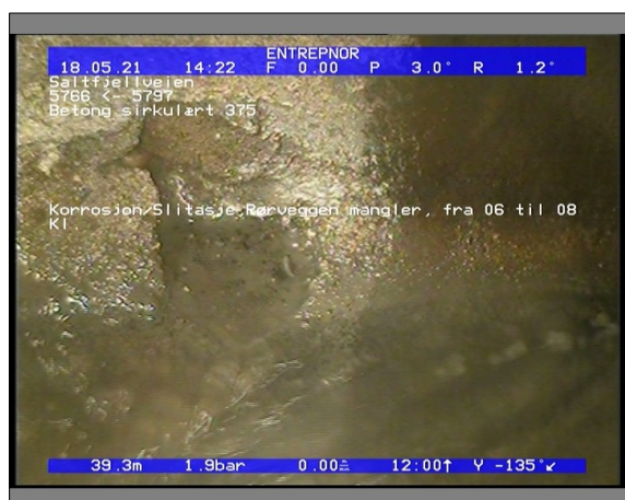
Foto: 6509_5766_5797_18052021_142217.JPG 39,31m, Korrosjon/Slitasje, Rørveggen mangler, fra 06 til 08 Kl.