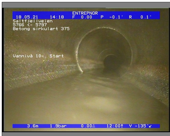
Foto: 6509_5766_5797_18052021_141831.JPG 3,67m, Vannivå 10%, Start