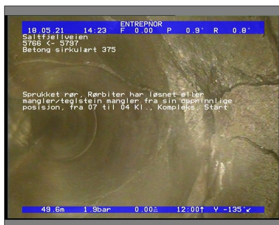
Foto: 6509_5766_5797_18052021_142329.JPG 49,6m, Sprukket rør, Rørbiten har løsnet eller mangler/teglstein mangler fra sin opprinnlige posisjon, fra 07 til 04 Kl., Kompleks, Start