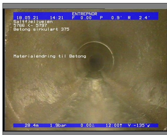
Foto: 6509_5766_5797_18052021_142124.JPG 28,44m, Materialendring til Betong