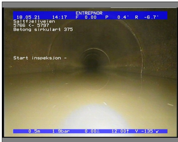
Foto: 6509_5766_5797_18052021_141739.JPG 0,5m, Start inspeksjon -