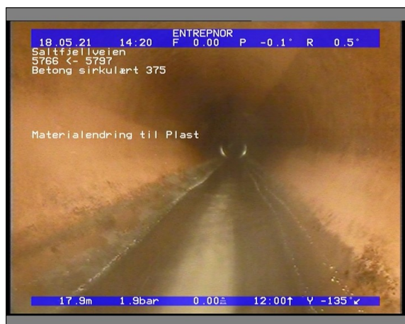
Foto: 6509_5766_5797_18052021_142007.JPG 17,95m, Materialendring til Plast