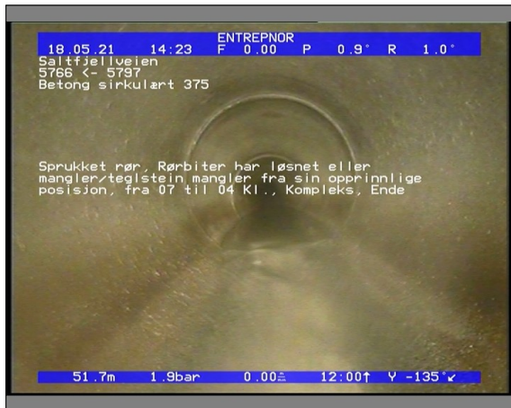
Foto: 6509_5766_5797_18052021_142400.JPG 51,76m, Sprukket rør, Rørbiter har løsnet eller mangler/teglstein mangler fra sin opprinnlige posisjon, fra 07 til 04 Kl., Kompleks, Ende