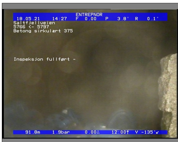
Foto: 6509_5766_5797_18052021_142704.JPG 91,89m, Inspeksjon fullført -