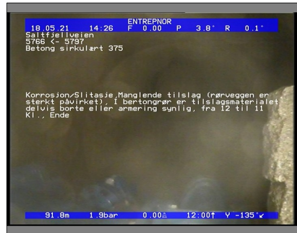
Foto: 6509_5766_5797_18052021_142635.JPG 91,89m, Korrosjon/Slitasje, Manglende tilslag (rørveggen er sterkt påvirket), I bertongrør er tilslagsmaterialet delvis borte eller armering synlig, fra 12 til 11 Kl., Ende