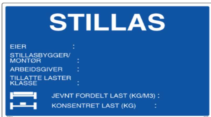
Eksempel på skilt