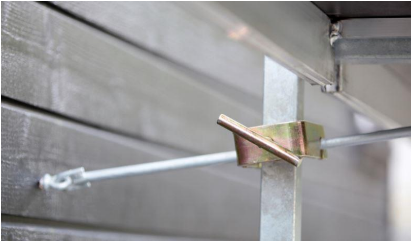
Eksempel på veggfeste. Veggfester skal være festet i spir eller ramme så nært knutepunkt med lengdebjelker som mulig.