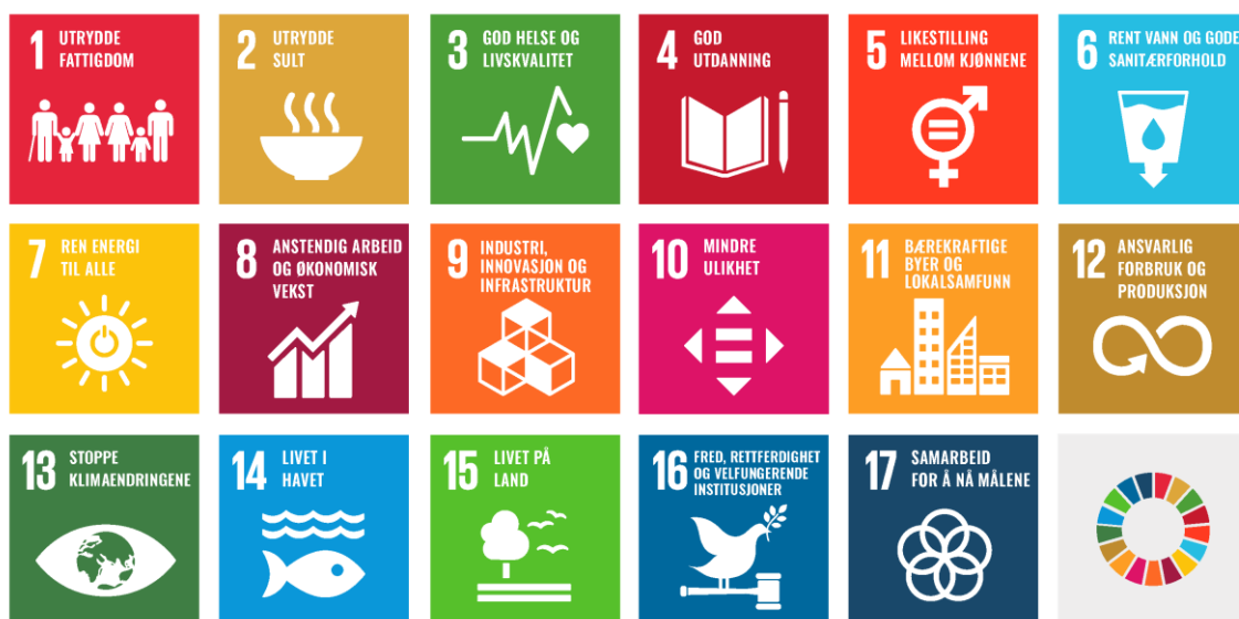
Figur 1 FNs 17 bærekraftsmål.

I 2015 vedtok FNs generalforsamling 2030-agendaen for bærekraftig utvikling. Agendaen har 17 utviklingsmål for å fremme sosial, miljømessig og økonomisk bærekraft. FNs bærekraftsmål