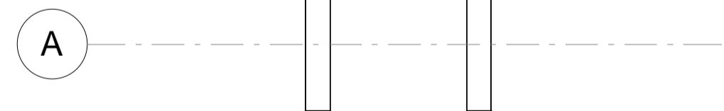
Detalj 2 1 : 20

Totalt 8stk WR-T-9x450 skruer per bjelke-søylekryss. 2stk skruer fra OK bjelke diagonalt og vekselvis.