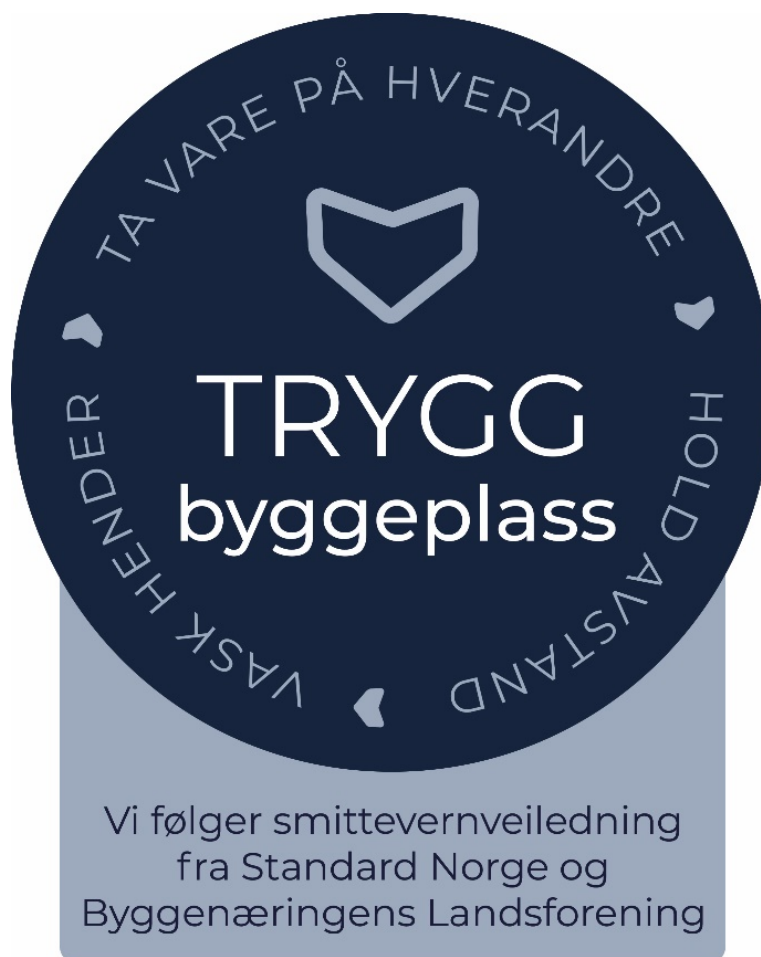
Figur 2 — Trygg byggeplass

Virksomheter som forplikter seg til å følge reglene og gjennomføre tiltakene i dette dokumentet, kan benytte emblemet vist på Figur 2.