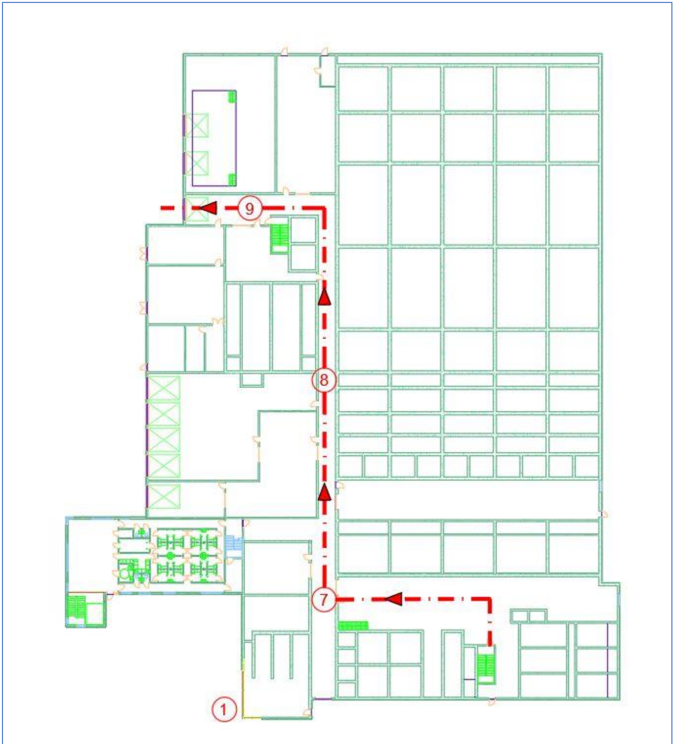
Bilde 1 Vannbehandling 1.etg