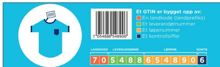
Figur 2 - Eksempel produkttypekoding, GTIN