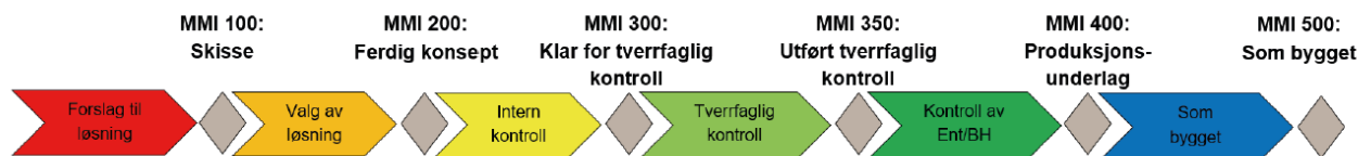
Figur 1 - Prosess MMI fra EBA

Prosjektet skal ha en omforent bruk av MMI-koder, som ved avtale kan tilpasses prosjektet utover koder angitt i veilederen. Egendefinerte MMI-koder og rutiner for bruk av disse skal omforenes i prosjektet og forankres i leverandørens BIM-gjennomføringsplan.