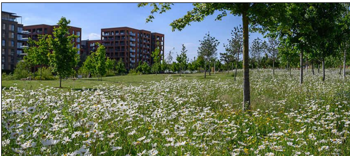
Figur 7. Blomstereng og bruksarealer kan lett kombineres, og danne miljøer med høy kvalitet både for mennesker og biologisk mangfold.