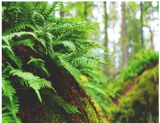
Figur 4. Bruk av forskjellige bregner og elementer i et skogsmiljø.