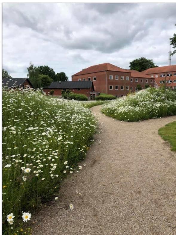
Figur 8. Sti gjennom blomstereng kan lages både med grus eller kortklipt gress.