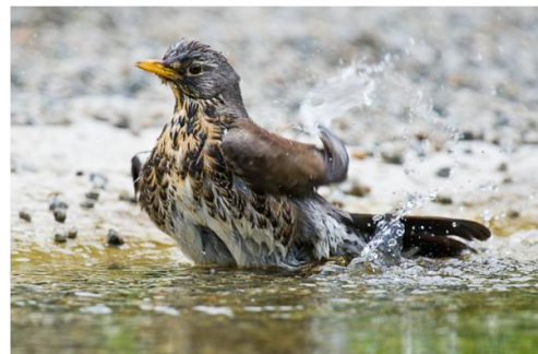
Figur 6. En liten dam kan danne habitat for mange forskjellige arter.