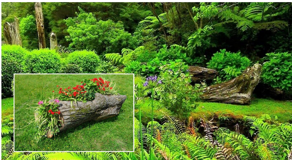
Figur 5. Dødvod som dekorative elementer med stor nytteverdi for biologisk mangfold.