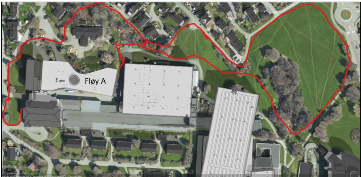
Figur 1. Disponibelt grøntområde for fløy A er avgrenset med rød linje.

Dagens grøntarealer på tomta til planlagte Ocean Space Centre består av store plen-arealer og to partier med tresatt mark. Plenene er til dels tidligere dyrka mark, dels relativt nylige opparbeidede arealer, og dels gamle plen- arealer (se rapport fra kartlegging av biologisk mangfold). Gammel dyrka mark og unge plen-arealer kan endres fritt, mens i partier med gammel plen bør dagens artsinventar videreutvikles og forbedres med innføring av nye arter, heller enn å fjerne vegetasjonen og starte et nytt suksesjonsforløp. Skogsarealet i Spruten har verdi for arter med dagens tilstand, og bør ikke endres i BREEAM-sammenheng, ut over at stokker fra felte trær kan legges inn som dødvedelementer. Den tresatte marka nord for Tyholtunet barnehage er en «ung» skogsmark som enda ikke har opparbeidet den verdifulle skogbestandsdynamikken, og kan med fordel settes i stand med innføring av dødvedelementer, steinrøyser, fuglekasser og annen tilrettelegging for biologisk mangfold. Eksisterende tresjikt bør utvikles fritt.