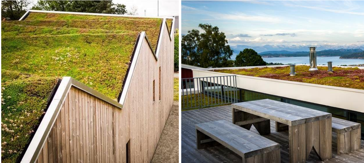
Figur 2. Bildene illustrerer sedum-tak med ulike vinkler og er hentet fra nettet for inspirasjon

Tørreng er et annet eksempel på grønne tak. Tørrenga vil inneholde et mye høyere biologisk mangfold enn et tradisjonelt sedumtak og det anbefales derfor at dette prioriteres der det planlegges flatt tak, eventuelt terrasse. Her må det plantes inn arter som forekommer naturlig i de norske kulturmarksengene og sås frø fra norske populasjoner (se tabell 2 for eksempler). NIBIOs tørrengblanding danner et fint grunnlag med ulike norske frø som sås på høsten i et næringsfattig vekstmedium, gjerne iblandet en del sand.