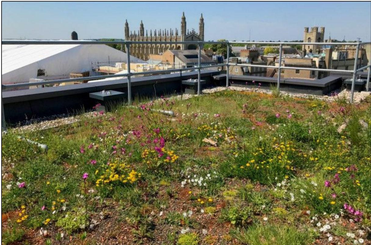
Figur 3. Taket på David Attenborough Building i Cambridge. Bildet er hentet fra https://livingroofs.org/

Et alternativ er å legge til rette for et større mangfold på sedumtaket. Her kan det med fordel plantes inn flere arter som naturlig vokser på åpen grunnlendt mark (se tabell 3 for eksempler). Det bør bygges opp områder med litt stein, grus og sand der disse artene plantes inn. I tillegg bør det legges inn noen områder med naken sand (0-8 mm) og nakne steinrøyser for å tilrettelegge for enkelte solitære bier i både tørreng og sedummatter. Død ved og/eller insektshotell på tak/terrasse vil tilrettelegge ytterligere for biologisk mangfold.