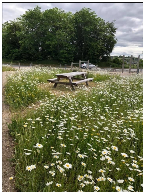
Figur 9. Denne blomsterengen er bare to år gammel. Artsinventaret vil bli større på sikt.