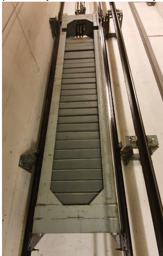
2.01.9 – Bilde av motvekt. Generelt benyttet ekspansjonsbolter på alle festejern.