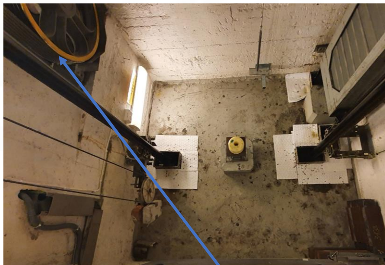
2.01.2 Gruven – Tilbyder må rengjøre male gulvet med oljebestendig maling. Motor er plassert i nederste plan på venstre side av sjakten i samme rom som hovedtavle for bygg.