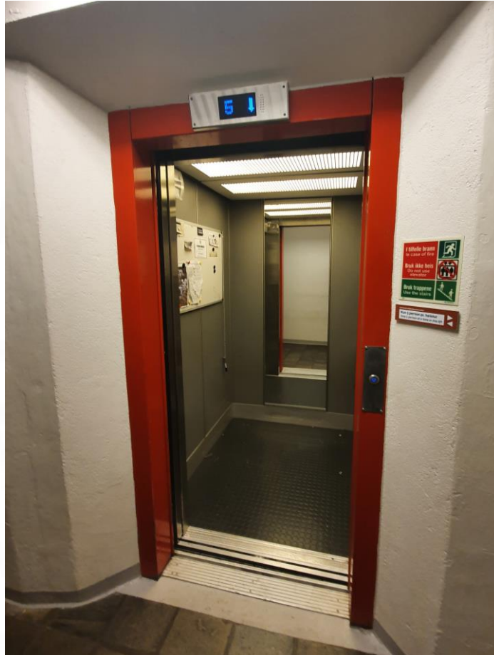
2.01.1 Oversiktsbilde – heis