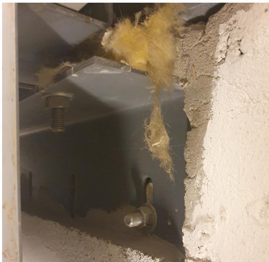
2.01.7 Bilde av innfesting av sjaktdør sett fra innsiden og under en av dørene.