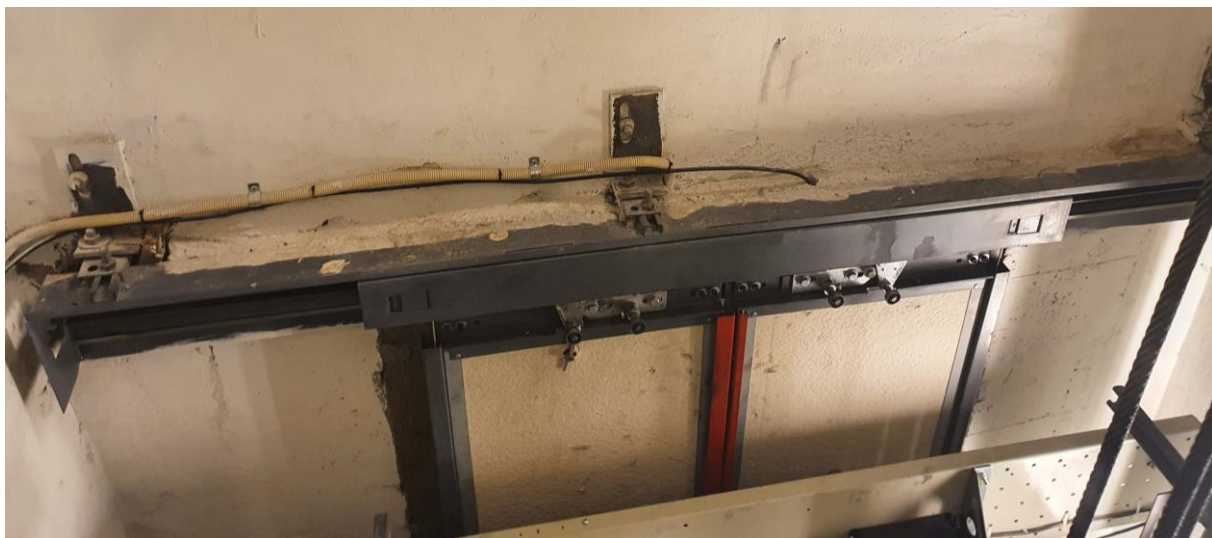
2.01.6 Bilde av sjaktdør på innsiden av sjakten.