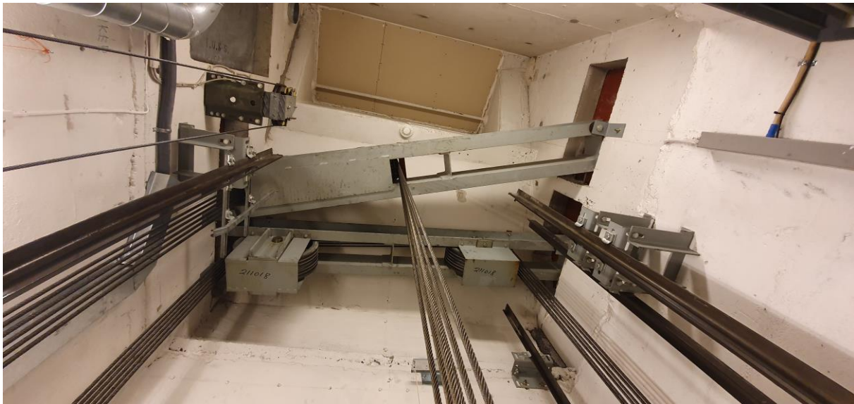
2.01.8 – Bilde av sjakttopp. Spesiell løsning. Alle utbedringer som må utføres for å få ny heis inn i sjakten skal være inkludert. Gjelder også prosjektering.