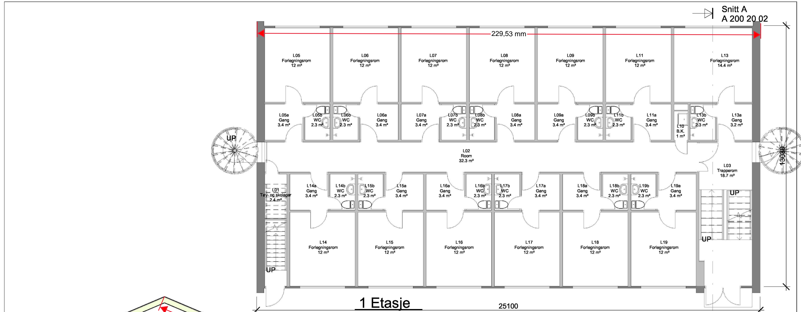
1 Etasje 1 : 100