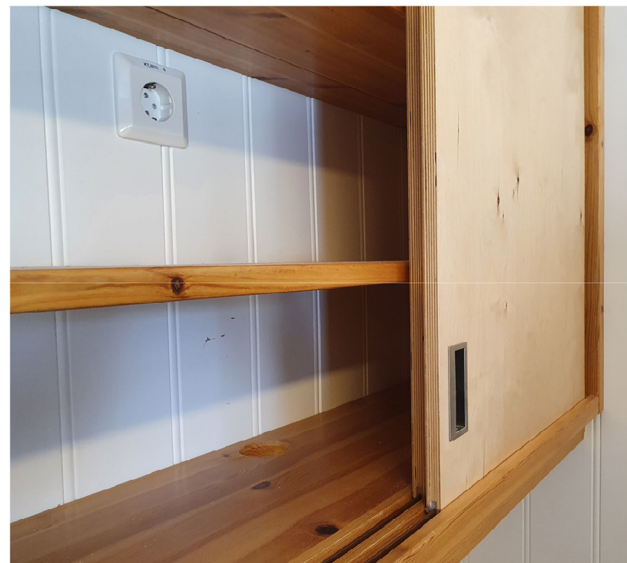
Skyvedør forsterket innredning