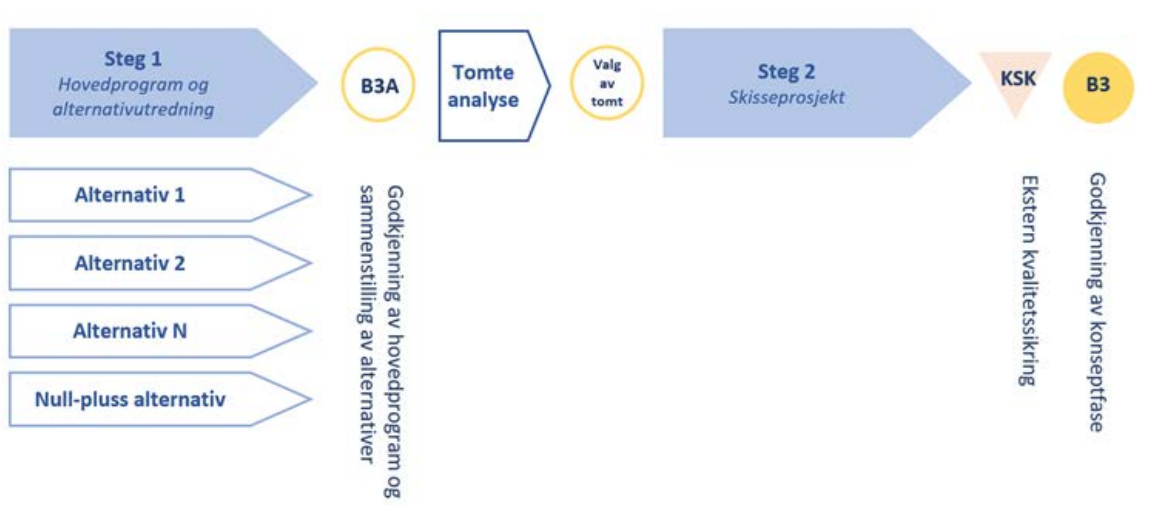
Figur 1: Prosjektmodell konseptfasen

Gjennomføring av konseptfasen er illustrert i figuren under.