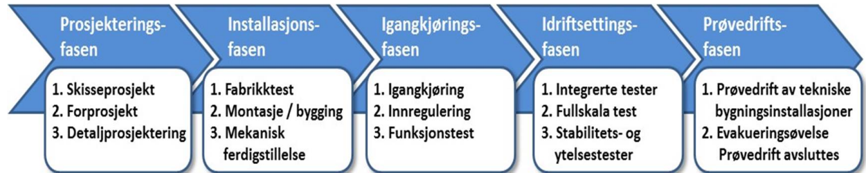
Figur 1 – Prosessene, fasene:

Tekniske entreprenører skal medta kostnader som følger av beskrevet ITB-arbeid.