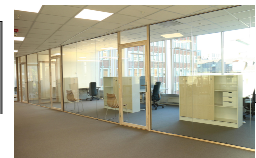
Kontorfront med tilsvarende utførelse med glassfelt, glassdør m/ramme, hvitlaseret eik