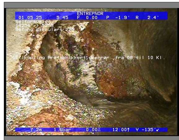
Foto: 27890_5253_14254_05022021_053056.JPG 7,23m, Tilkopling Prefabrikkert grennrør, fra 08 til 10 Kl.