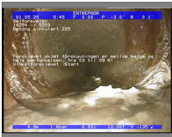
Foto: 27890_5253_14254_05022021_053027.JPG 4,91m, Forskjøvet skjøt forskyvningen er mellom halve og hele rørtykkelsen, fra 03 til 09 Kl., Vinkelforskjøvet, Start