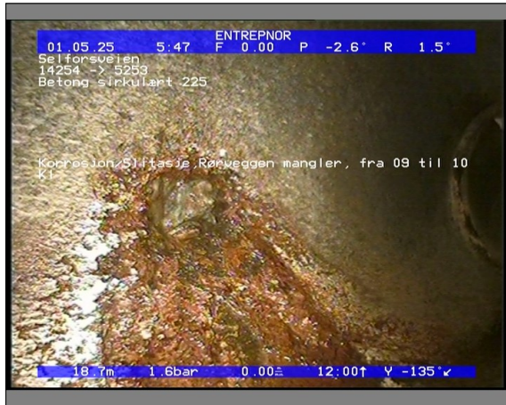
Foto: 27890_5253_14254_05022021_053215.JPG 18,72m, Korrosjon/Slitasje,Rørveggen mangler, fra 09 til 10 Kl.