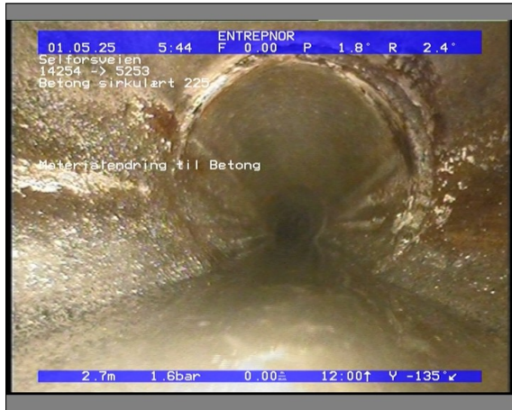
Foto: 27890_5253_14254_05022021_052935.JPG 2,71m, Materialendring til Betong