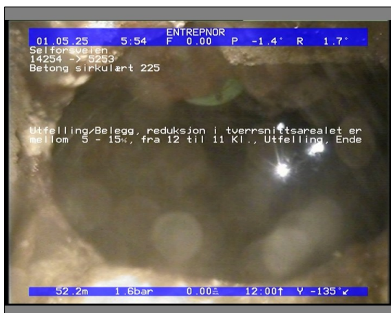
Foto: 27890_5253_14254_05022021_053921.JPG 52,27m, Utfelling/Belegg, reduksjon i tverrsnittsarealet er mellom 5 - 15%, fra 12 til 11 Kl., Utfelling, Ende