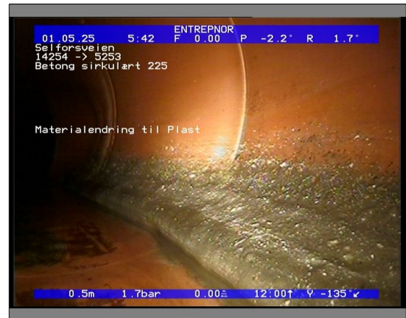
Foto: 27890_5253_14254_05022021_052737.JPG 0,5m, Materialendring til Plast