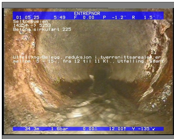
Foto: 27890_5253_14254_05022021_053438.JPG 34,39m, Utfelling/Belegg, reduksjon i tverrsnittsarealet er mellom 5 - 15%, fra 12 til 11 Kl., Utfelling, Start