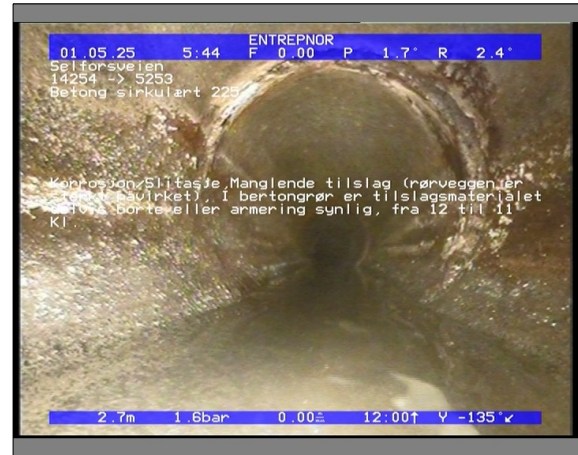
Foto: 27890_5253_14254_05022021_052946.JPG 2,71m, Korrosjon/Slitasje, Manglende tilslag (rørveggen er sterkt påvirket), I bertongrør er tilslagsmaterialet delvis borte eller armering synlig, fra 12 til 11 Kl., Start