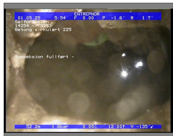
Foto: 27890_5253_14254_05022021_053936.JPG 52,27m, Inspeksjon fullført -