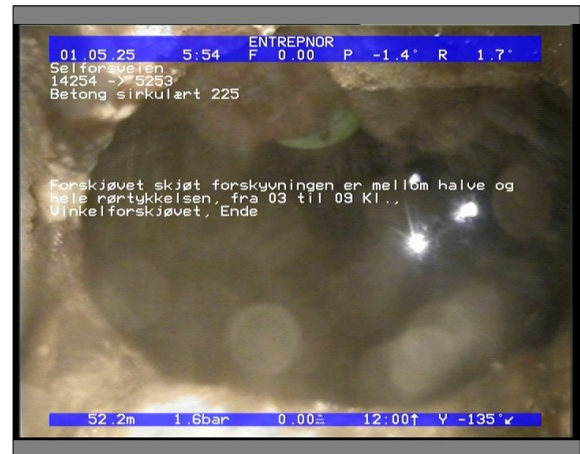
Foto: 27890_5253_14254_05022021_053914.JPG 52,27m, Forskjøvet skjøt forskyvningen er mellom halve og hele rørtykkelsen, fra 03 til 09 Kl., Vinkelforskjøvet, Ende