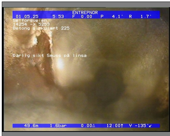
Foto: 27890_5253_14254_05022021_053825.JPG 49,66m, Dårlig sikt Smuss på linsa