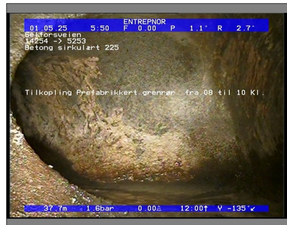
Foto: 27890_5253_14254_05022021_053512.JPG 37,79m, Tilkopling Prefabrikkert grennr. fra 08 til 10 Kl.