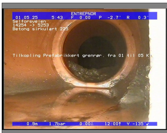
Foto: 27890_5253_14254_05022021_052816.JPG 0,95m, Tilkopling Prefabrikkert grennrør. fra 01 til 05 Kl.