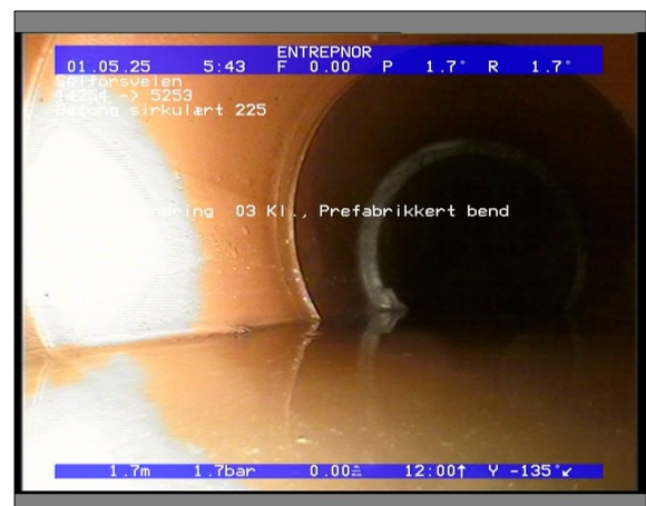
Foto: 27890_5253_14254_05022021_052852.JPG 1,7m, Retningsendring 03 Kl., Prefabrikkert bend