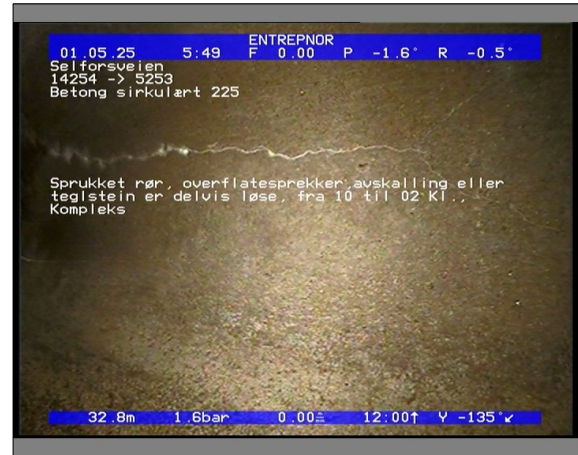
Foto: 27890_5253_14254_05022021_053413.JPG 32,88m, Sprukket rør, overflatesprekker,avskalling eller teglstein er delvis løse, fra 10 til 02 Kl., Kompleks