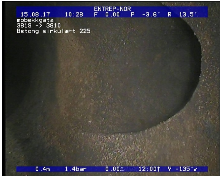
Foto: 10_10_465_A.JPG 0,47m, Tilkopling Sadelgren med innhugget hull fra 10 til 02 Kl., i kum