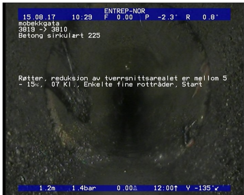
Foto: 10_10_466_A.JPG 1,2m, Røtter, reduksjon av tverrsnittsarealet er mellom 5 - 15%, 07 Kl., Enkelte fine rottråder, Start