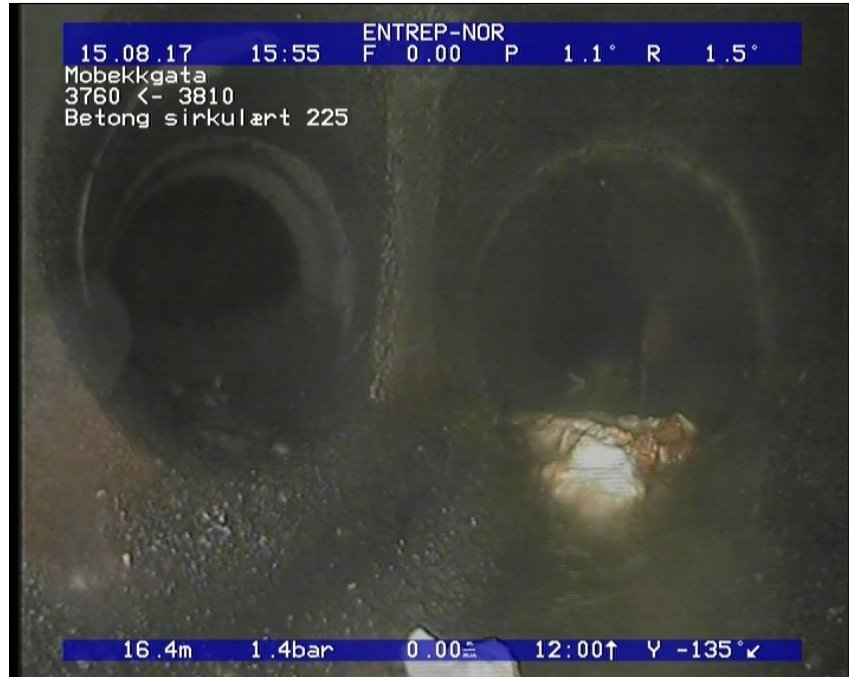
Foto: 8_8_480_A.JPG 16,49m, Tilkopling Sadelgren med innhugget hull fra 08 til 11 Kl.