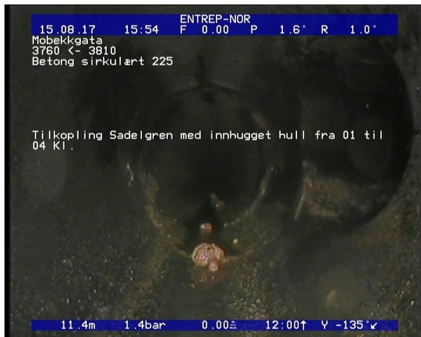
Foto: 8_8_479_A.JPG 11,46m, Tilkopling Sadelgren med innhugget hull fra 01 til 04 Kl.