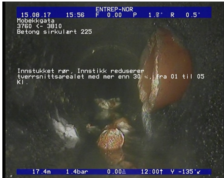
Foto: 8_8_481_A.JPG 17,44m, Innstukket rør, Innstikk reduserer tverrsnittsarealet med mer enn 30 %, fra 01 til 05 Kl.