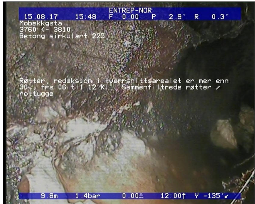
Foto: 8_8_478_A.JPG 9,88m, Røtter, reduksjon i tverrsnittsarealet er mer enn 30%, fra 06 til 12 Kl., Sammenfiltrede røtter / rottugge