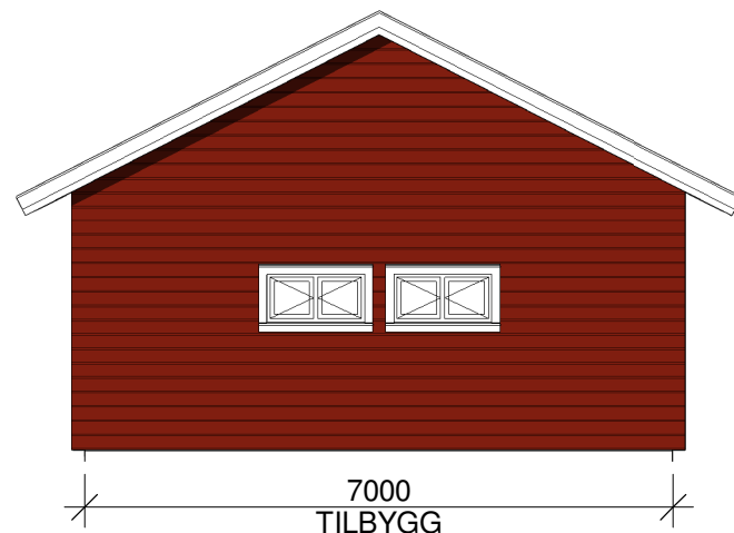
SØR 1 : 100