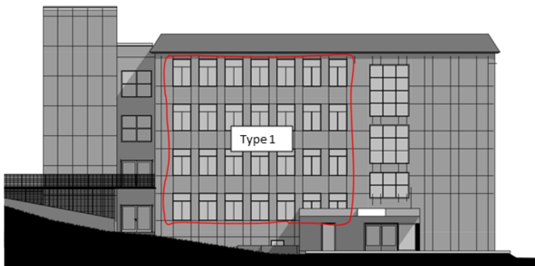
Figur 1- Fasade vest - Bygg 7 - Kristiansund vgs

Flatene er markert med rødt på figur 1 - 3.