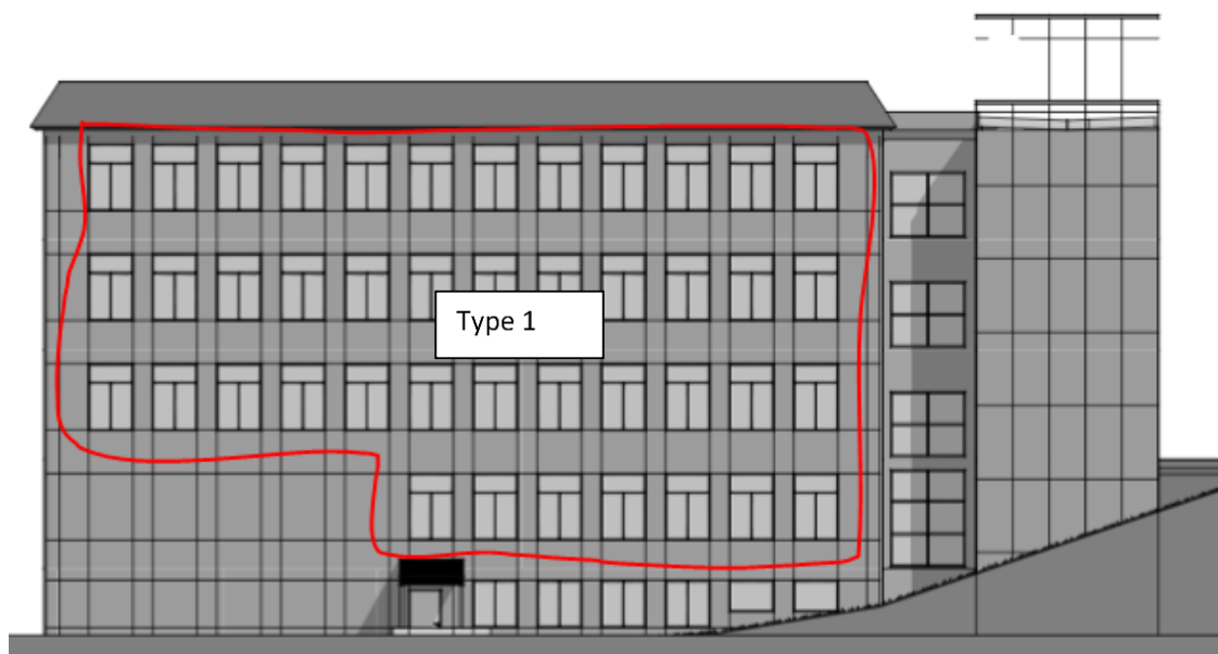
Figur 3 – Fasade øst – Bygg 7, Kristiansund vgs