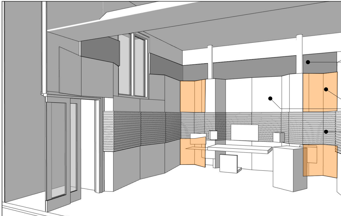
Illustrasjon Studio - mot vest - ny situasjon