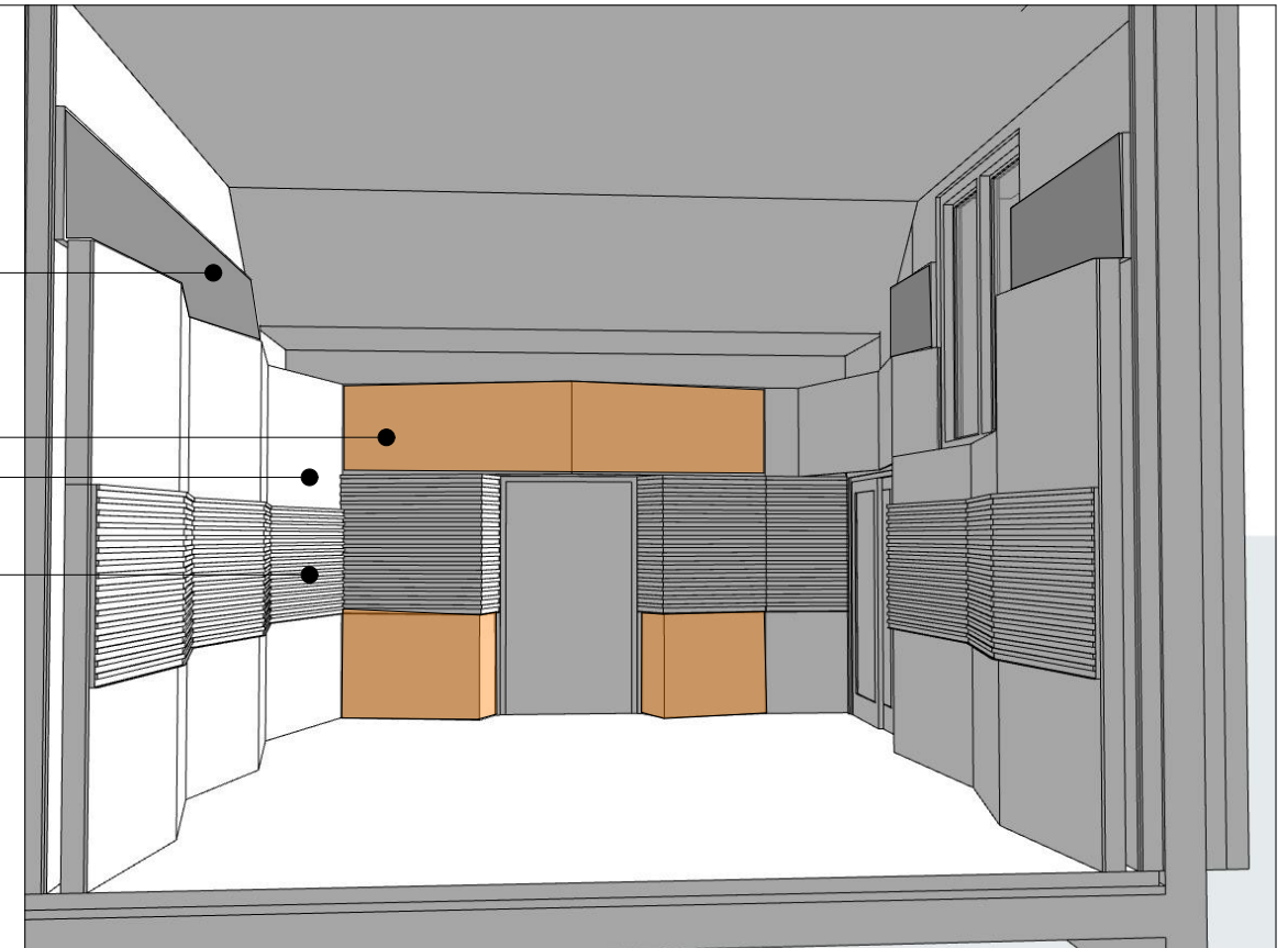
Illustrasjon Studio - mot øst - ny situasjon