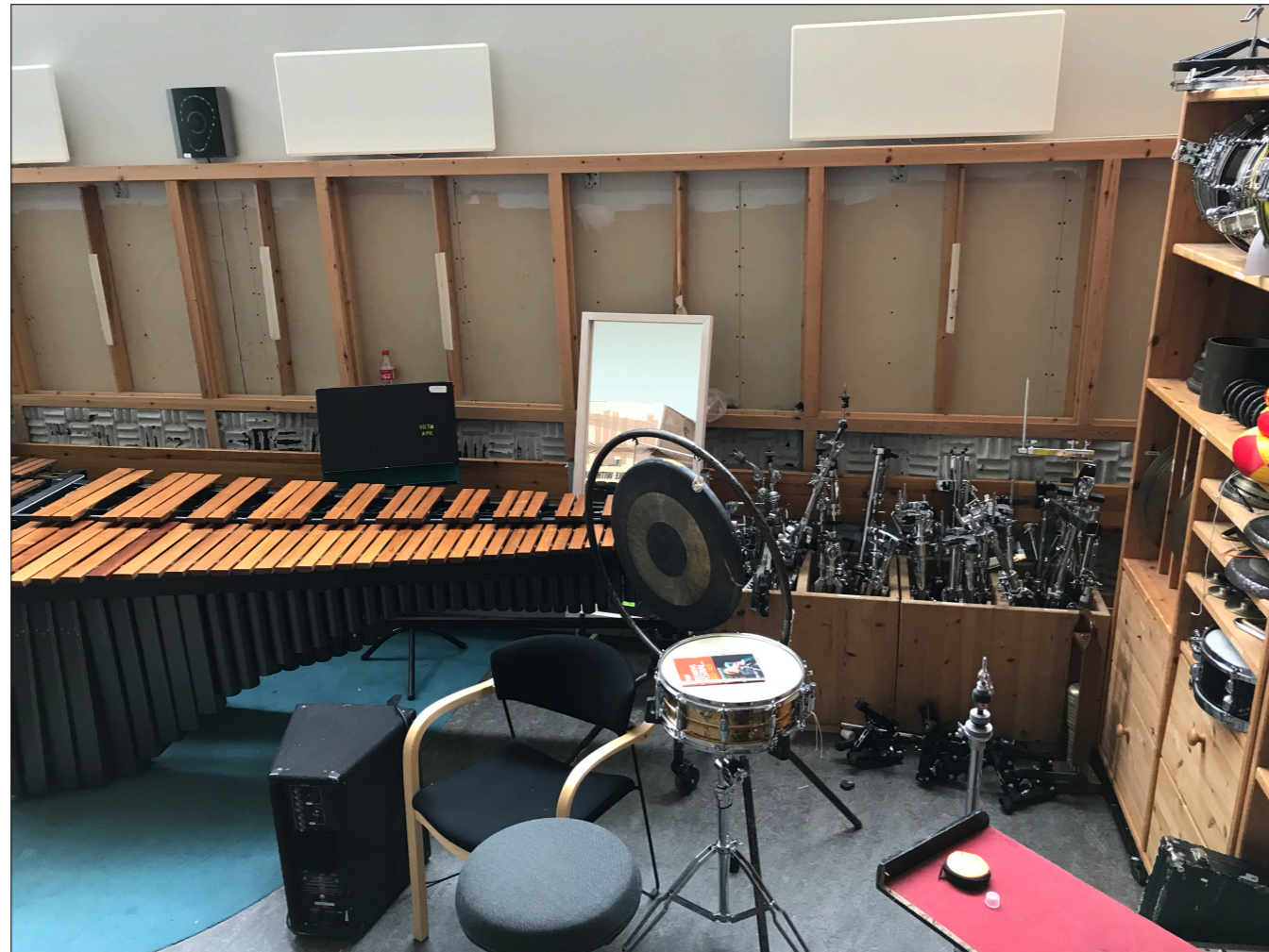
Slagverkrom - eks. veggabsorbenter med trerammer demonteres