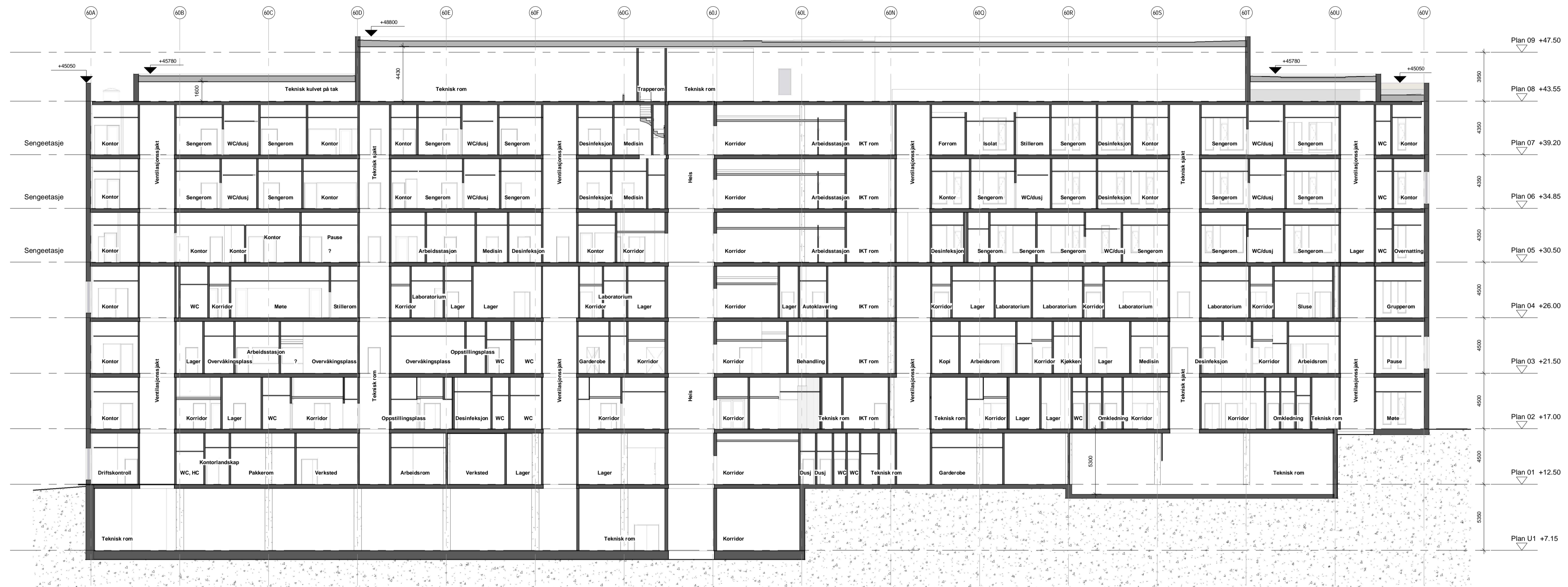
Lengdesnitt bygg 1260 - Avsnitt C og D