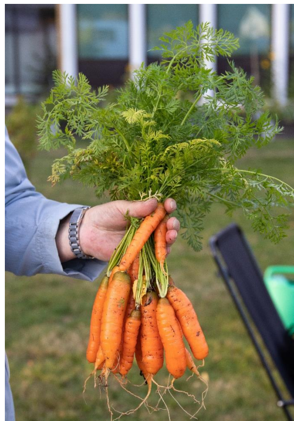
Bilde 1 Det spirer og gror på Knutepunkt Strømsø