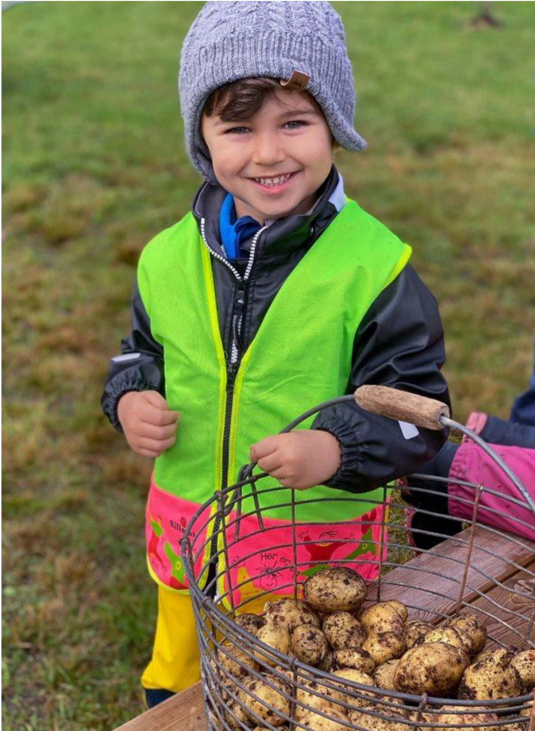
Bilde 6 Potetplukking i Strømsøhagen

«Strømsøhagen utvikles som bydelens grønne lunge og samlingsplass for beboerne. Det skal være et sted der beboerne i området kan få et fellesskap, og hagen samler flere av knutepunktets målsettinger gjennom dialog og medvirkning på en attraktiv møteplass.»