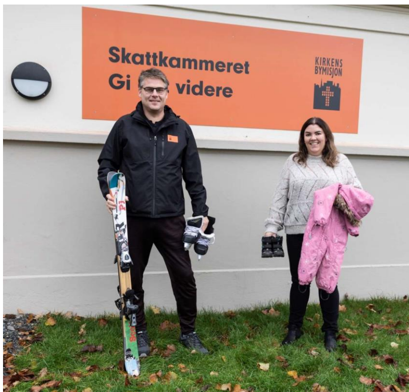
Bilde 2 Kirkens Bymisjon lokalisert i det gamle toalettbygget på Knutepunkt Strømsø