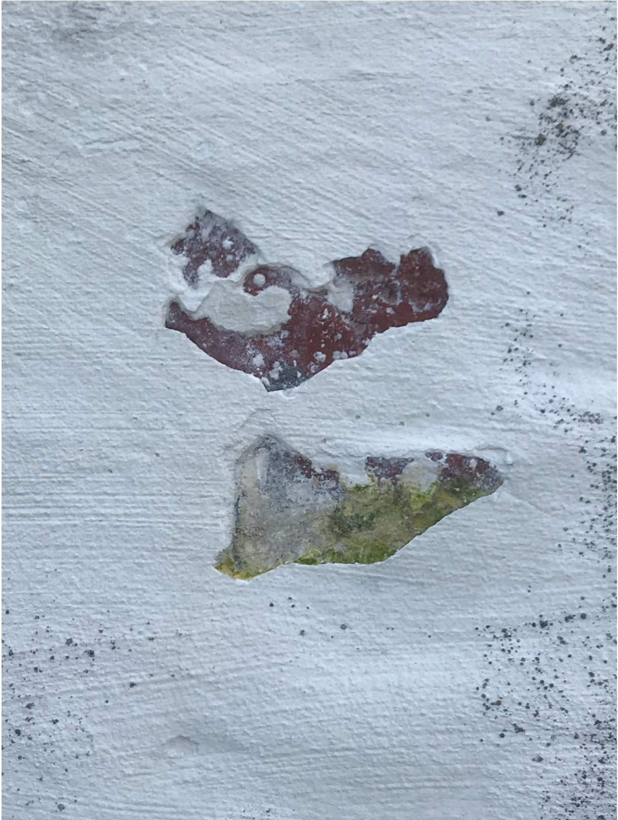
Bildet viser sår i pussen som er ønsket pusset med NHL 5 0-4mm puss.