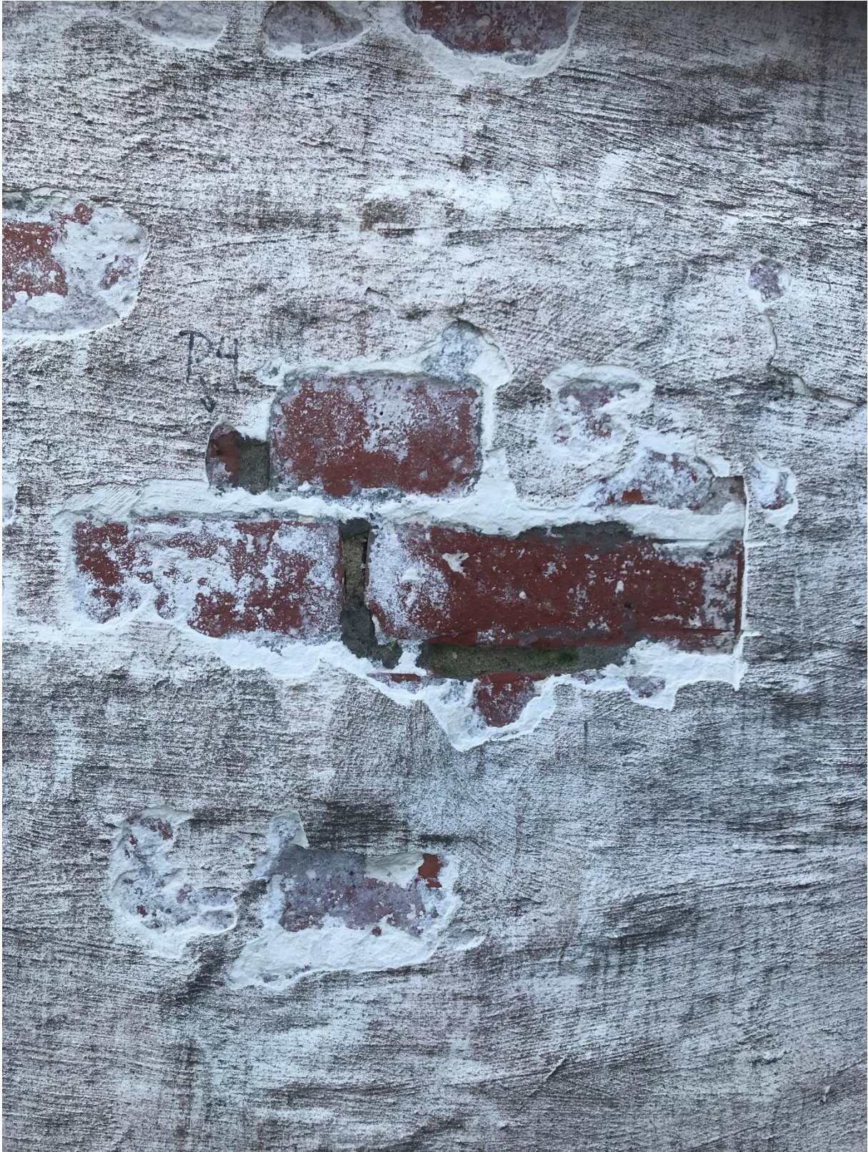
Annen skadebilde på veggen.