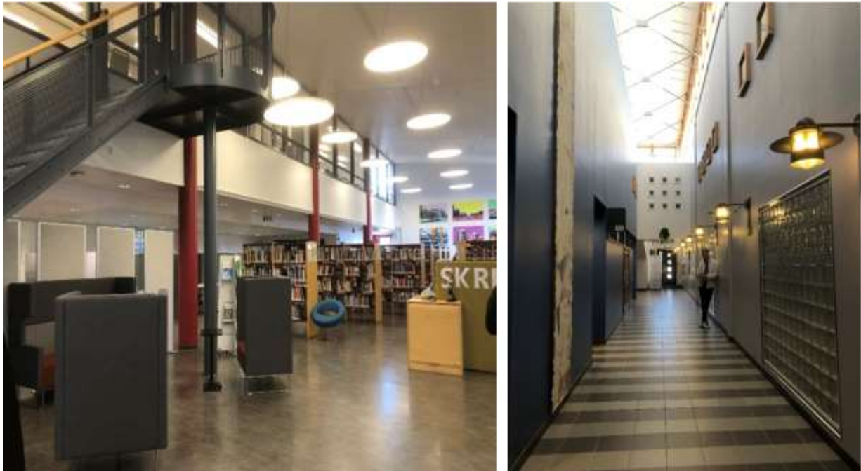
Figur 2 Eksisterende undervisningsrom i 2. etasje har tilkomst via trapp fra biblioteket. Rommet skal utvides mot nord over biblioteket og mot sør over korridor.

Undervisningsrommet består i dag av to rom – en lesesal lengst vest og et undervisningsrom i øst. Undervisningsrommet har adkomst via trapp fra biblioteket og fra hall i 2. etasje. Lesesalen har tilkomst gjennom undervisningsrommet.