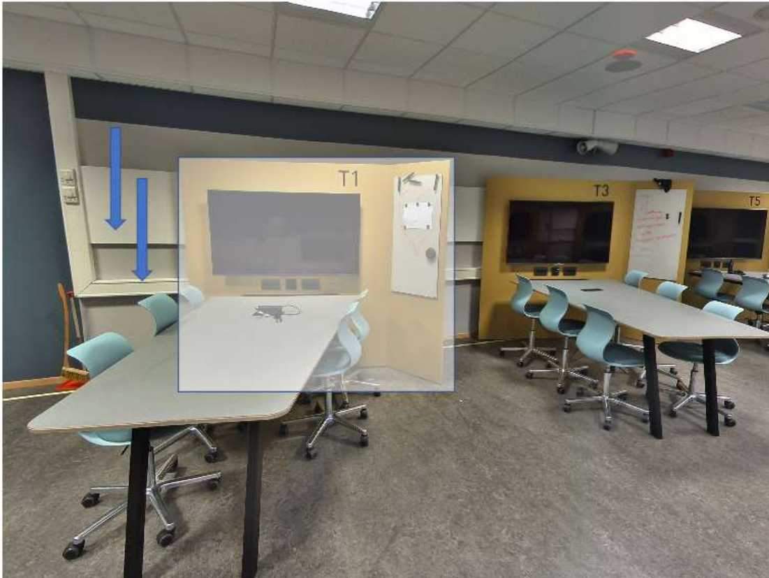
Figur 3 Teknisk infrastruktur inngår i entreprisen, videre skal TE sørge for nødvendige tiltak for å tilfredsstille de akustiske kravene. Brukerutstyr som møbler, skjermer og møbel til å feste skjermer og Av-utstyr ved hvert gruppebord vist i skravert felt inngår ikke i oppdraget.

Tilbudsforespørselen inkluderer opsjoner, disse er nærmere beskrevet i funksjonsbeskrivelsen kap. 1.19.