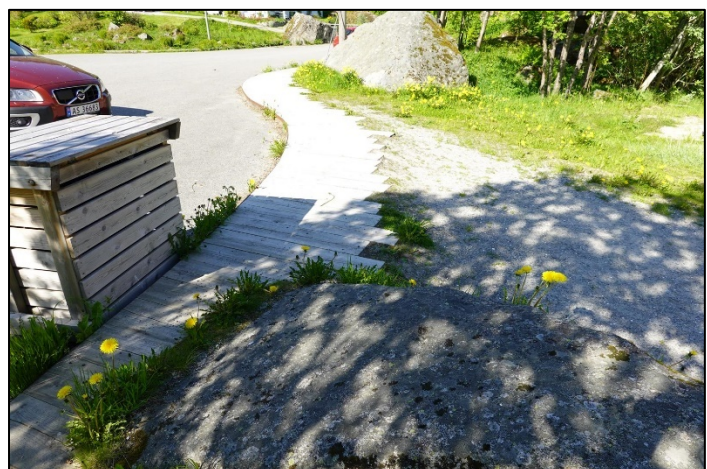
Foto av fortau og trapp i Nusfjord