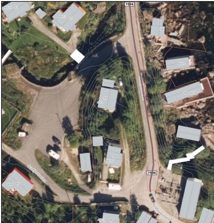
Nusfjord parkeringsplass med veisløyfe

Navn: Nusfjord parkeringsplass Beliggenhet: Flakstad kommune