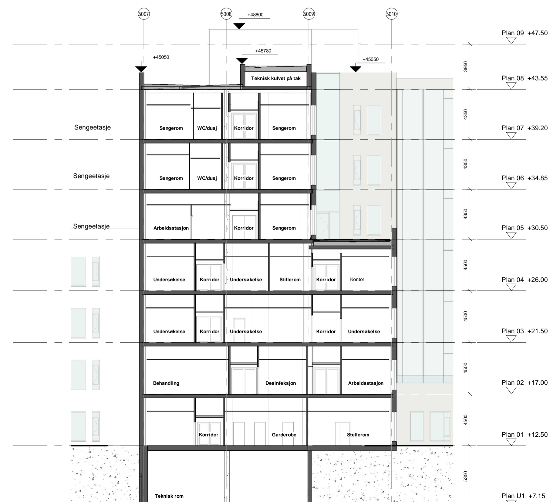
Tverrsnitt i bygg 1250 - Avsnitt F