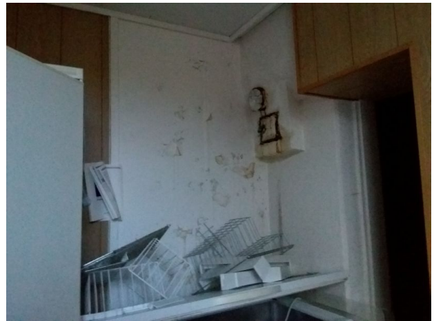
Lekkasje fra pipe.