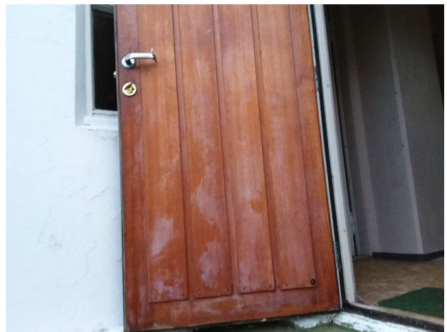
Muggsopp innvendig på dør