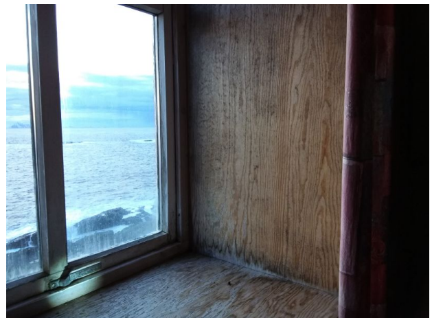
Muggsopp i vinduer