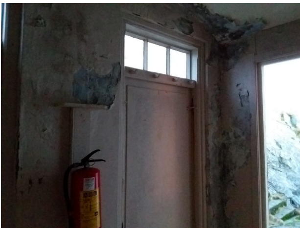
Muggsopp, salt og kalkutslag innvendig på yttervegg