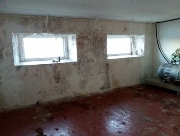
Muggsopp, salt og kalkutslag