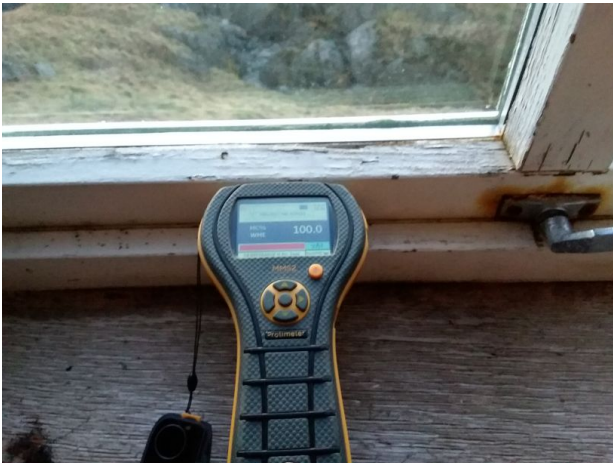
Fukt i vinduer trevirke mettet med fukt.