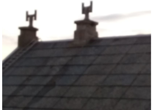
Rundt piper er det støpt en krans, men her er det nå lekkasjer på to av pipene.