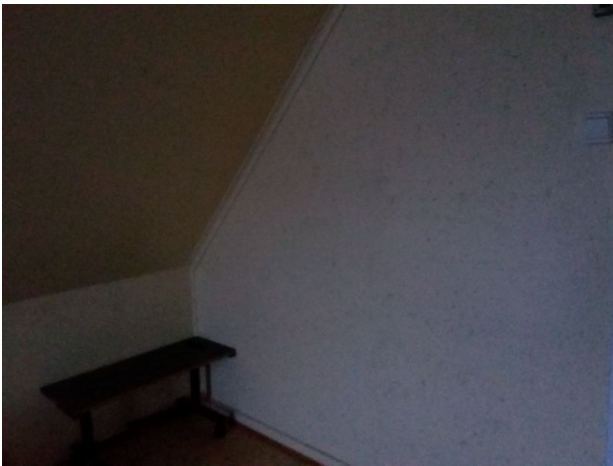
Muggsopper på innvendige vegger