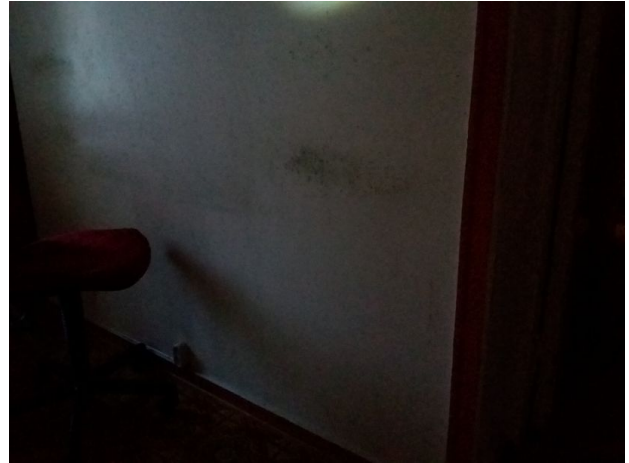
Muggsopper på innvendige vegger