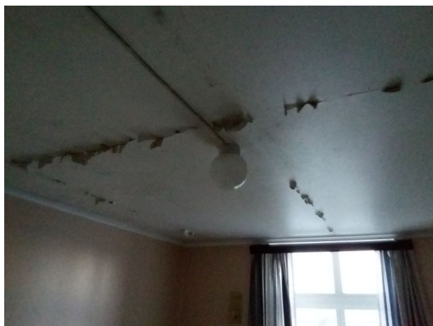
Lekkasje merker i tak 2.etg