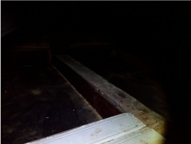
Borebille angrep i trevirke "haneloft"