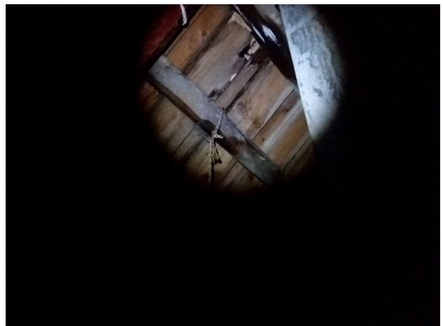
Muggsopp i sutak "haneloft"