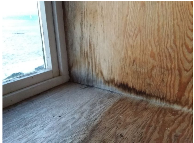
Fuktmerker etter lekkasje og kondens