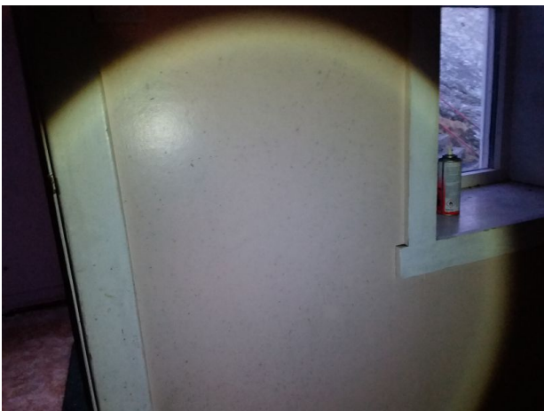
Muggsopp innvendige vegger