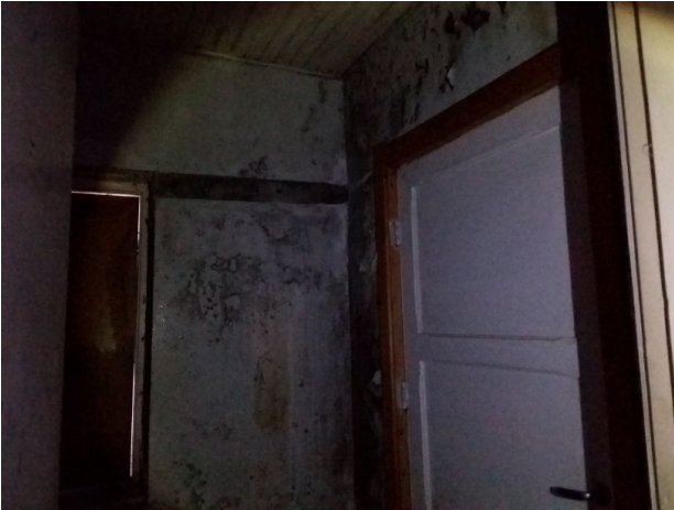
Mugg salt og kalk