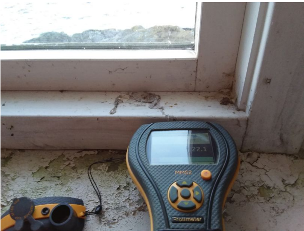
Vindu i kjeller trefukt over 22% trefukt