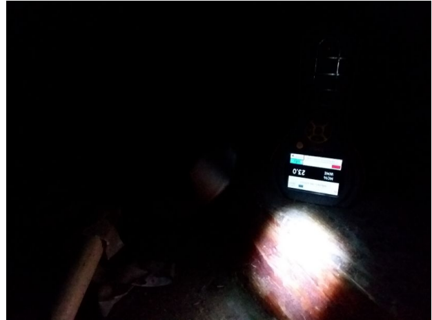
Trevirke på "haneloft" 23% trefukt