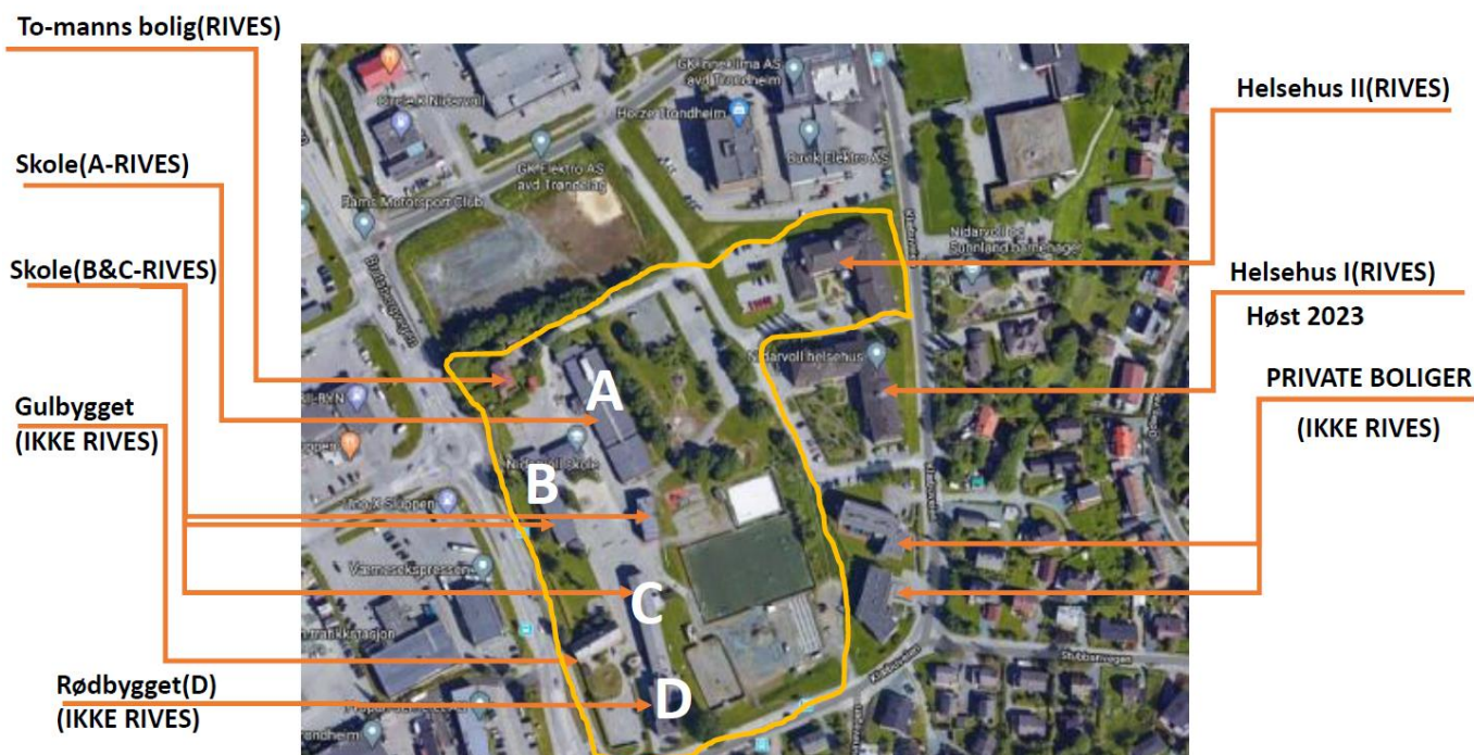
Figur 1: Situasjonsplan Nidarvoll-området

I tillegg skal dagens to Helsehus rives og erstattes med et nytt rehabiliteringssenter. Ett av helsehusene (Helsehus I) skal ikke rives før høsten 2023.