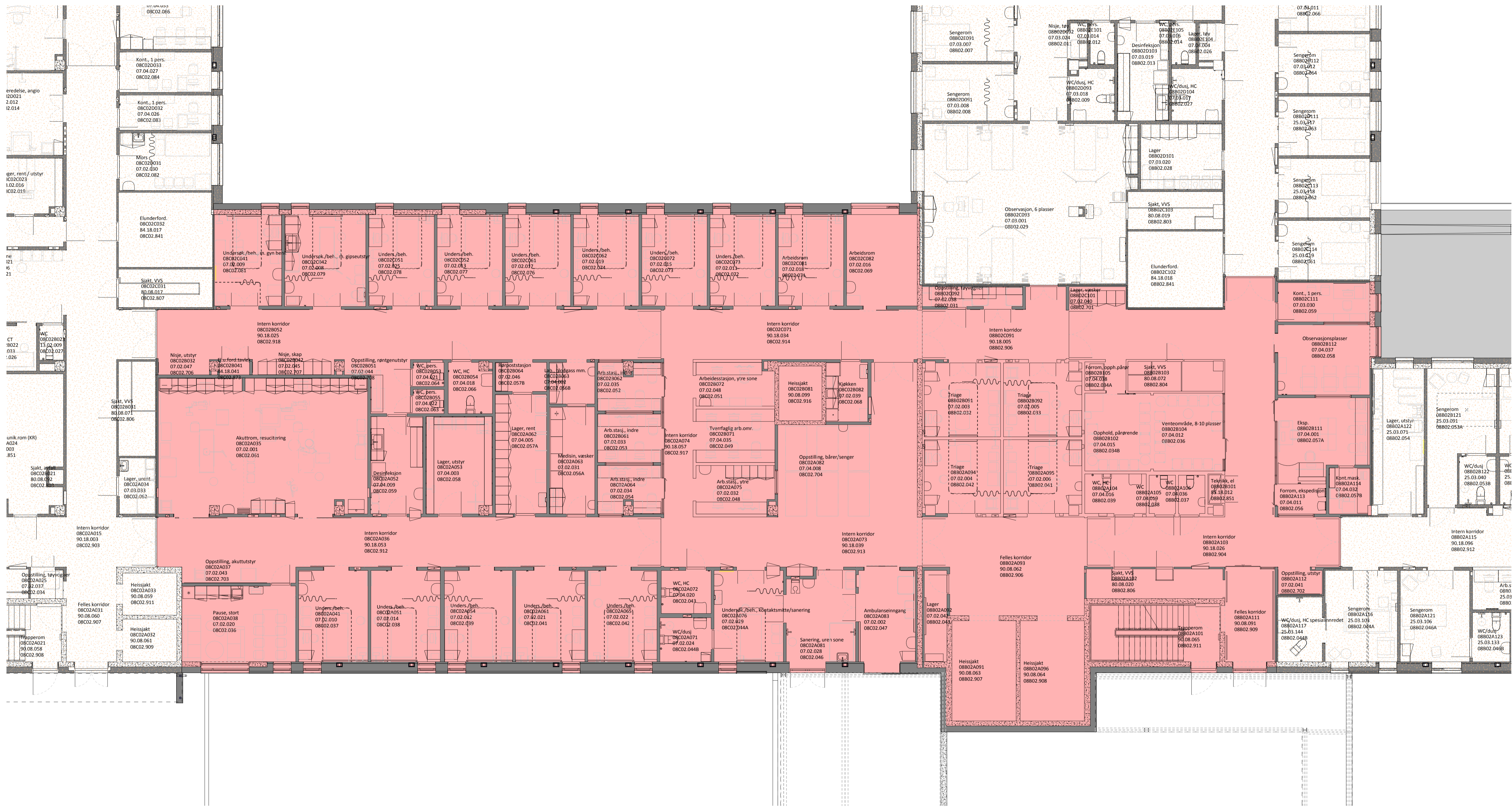
Plan 02 1 : 100