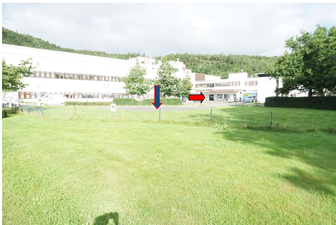
Rød pil akuttmottak, blå pil helikopterlandingsplass