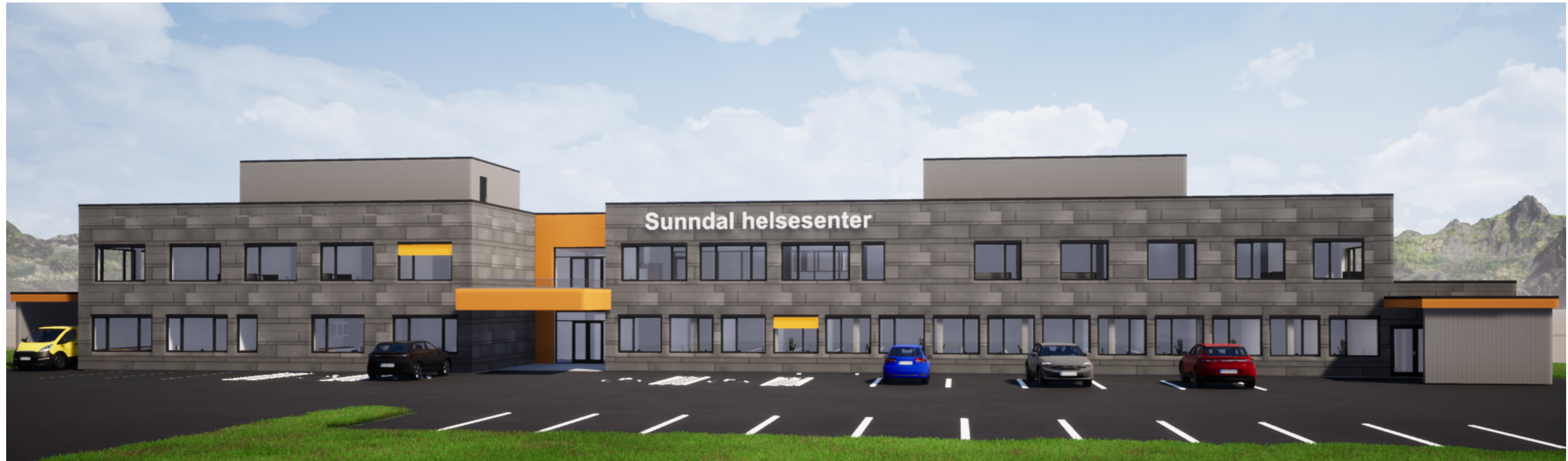
1:200 Fasade sør